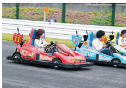
20日(土)のお昼にはサーキットカートでコース体験