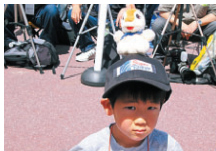
S耐のロゴまで入ってます