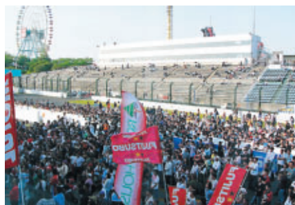
レース終了後はコース開放