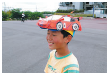
お父さんの手づくりだそうです