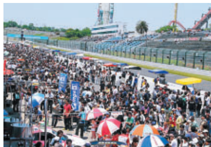
決勝前のピットウォーク