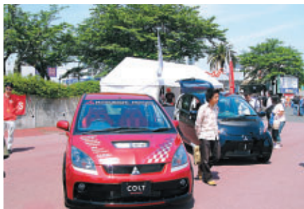
三菱車をGPスクエアに展示