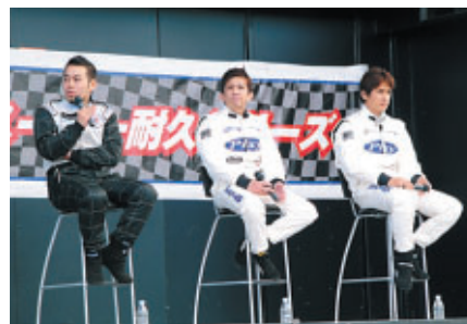
ドライバートークショー