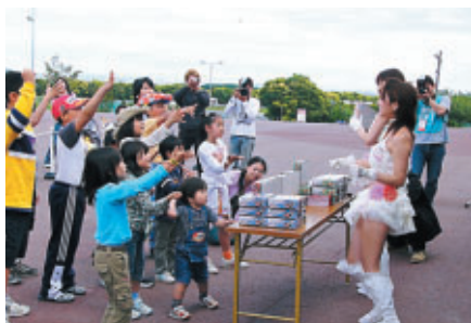
子供たち限定のジャンケン大会