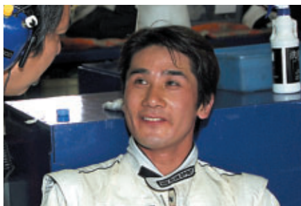
2輪全日本チャンピオン 伊藤真一選手