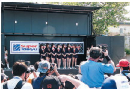
S耐オフィシャルステージ