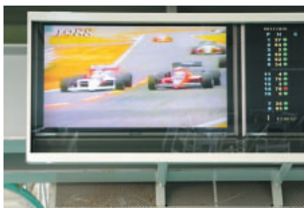
F1、8耐の名勝負をビジョンでオンエア