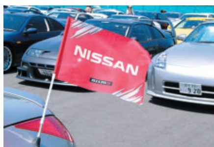
日産ファンの熱い気持ちが