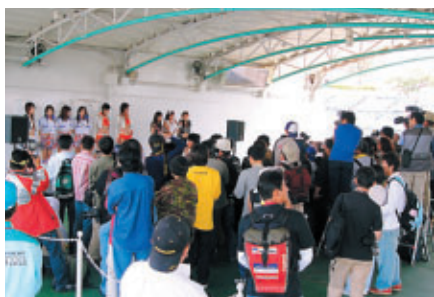
ピット上でのキャンギャルオンステージ