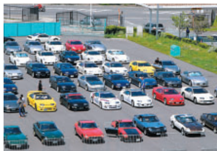
新旧フェアレディZが大集合 レーシングコースパレードも