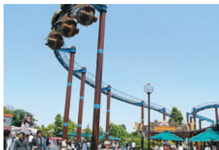
遊園地もレーシングコースも家族連れで賑わいました