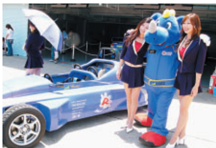
バットもピットウォークに登場