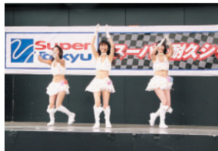
S耐イメージガール「St.Cherish」ライブ