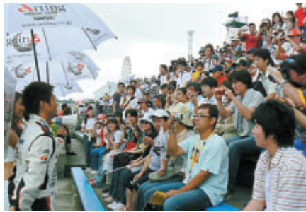
グラนด์スタンドの一角にサポーターズシートを設定

5月のもてぎラウンドで初めて実施され、大好評を博した「チームサポーターズシート」。今回は9チームのご協力をいただき、サポーターの皆さんとの触れ合いが実現しました。優勝したmobilecast TEAM IMPULのサポーターはピットレーンから表彰式を間近で体感、シャンパンシャワーを味わいました。さらに抽選でサポーター代表からB.トレレイエ選手に壇上で花束贈呈などビッグサプライズの連続でした。