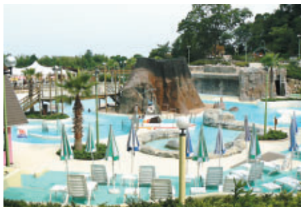
遊園地内のプール「アクア・アドベンチャー」もいよいよオープン