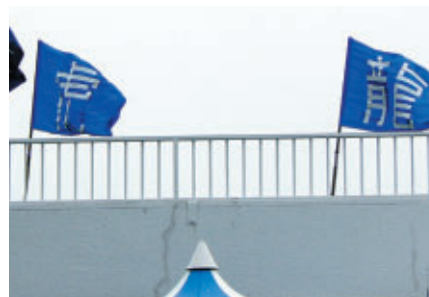
チーム・ルマンは「龍」「虎」