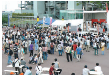
フォーミュラ・ニッポンステージを中心にレイアウトされたグランプリスクエア