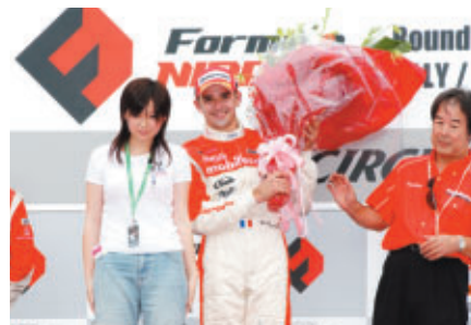
抽選で選ばれたサポーター代表から花束贈呈