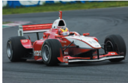
安定した走りで優勝した ブノワ・トレルイエ

※詳細なレポートは、以下HPサイトをご参照ください。 http://www.procione.com/suzukaland/4r/fn_index.htm フォーミュラ・ニッポン公式サイト http://www.f-nippon.co.jp/