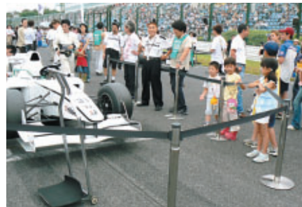
レース直前のグリッドにアクセスできるグリッドウォーク