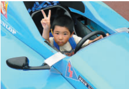
フォーミュラEnjoyの Cockpit 体験