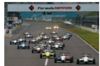
フォーミュラチャレンジ・ジャパン 第1戦 安田裕信 (NISSAN DDP FCJ) 第2戦 関口雄飛 (FTRS ギャマットマセキFCJ)