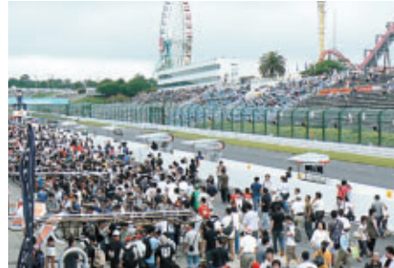
決勝前のピットウォーク