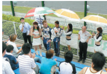
選手・監督・キャンギャルが一堂に