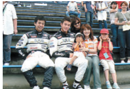
ちびっこファンと記念撮影