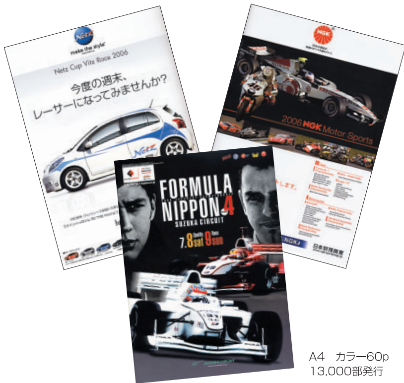
A4 カラー60p 13,000部発行

株式会社 アライヘルメット 株式会社 アイデア NTTコミュニケーションズ 株式会社 株式会社 オートボックスセブン 5ZIGENインターナショナル 株式会社 株式会社 三栄書房 株式会社 三推社 ダンロップファルケンタイヤ 株式会社 トヨタ自動車 株式会社 トヨタテクノクラフト 株式会社 株式会社 二玄社 日本特殊陶業 株式会社 株式会社 フジテレビジョン 株式会社 プリヂェストン 本田技研工業 株式会社 株式会社 ホンダダイレクトマーケティング モーターマガジン社