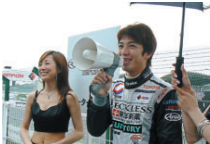
ドライバー自らが肉声で抱負を語りました