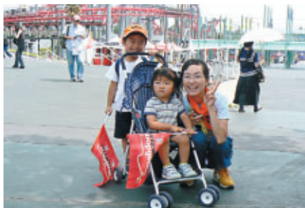
予選日は夏空 親子でエンジョイ!