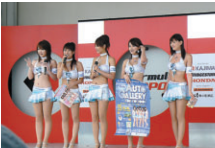
「東京オートギャラリー」ギャルがイベントをPR