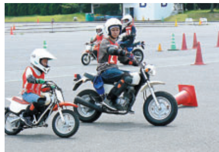
交通教育センターでは「親子バイク教室」を開催