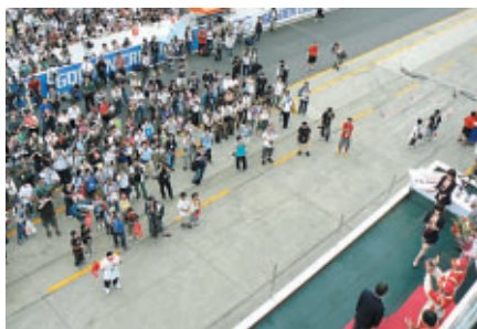
mobilecast TEAM IMPULサポーターはピットレーンから祝福