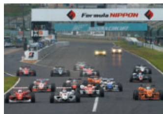
全日本F3選手権 第9戦 塚越広大 (Honda TEAM無限) 第10戦 伊沢拓也 (Honda TODA RACING)