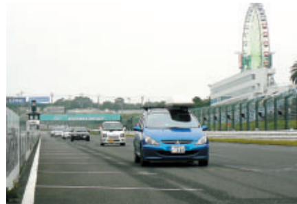
レース後の余韻覚めやらぬコースをマイカーで体験走行