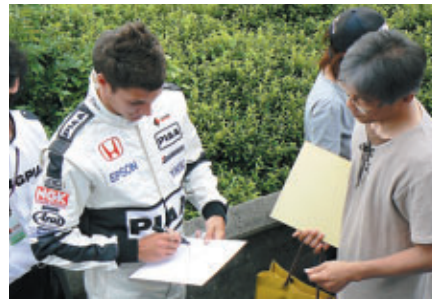
気軽にサインをもらえるフレンドリーな雰囲気