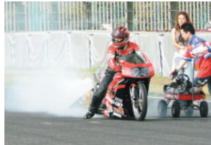
コース上で行なわれた迫力のドラッグマシンデモ走行