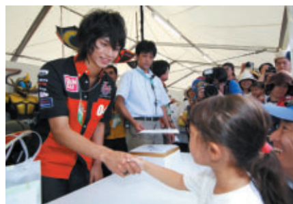
仮面ライダーカブト主人公役の水嶋ヒロ握手会