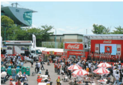
プロモーションブースが集約されたグランプリスクエア