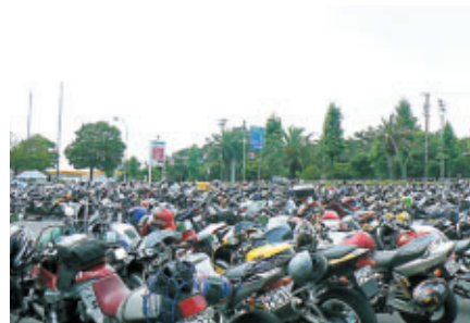
正面ゲート 2輪駐車場