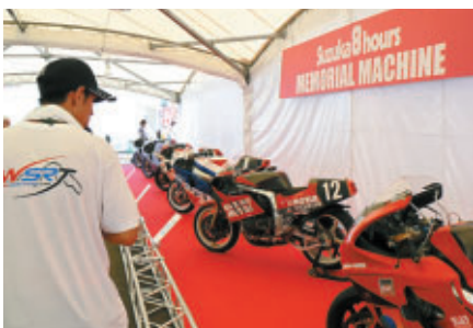
歴代の8耐マシンを一堂に展示