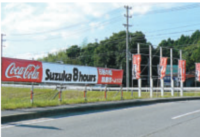
伊勢鉄道・鈴鹿サーキット稲生駅のウェルカムディスプレイ