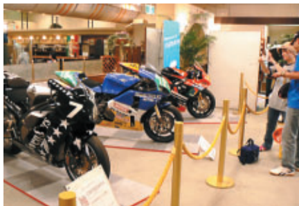
レストラン街「味の街」にも歴代マシンを展示