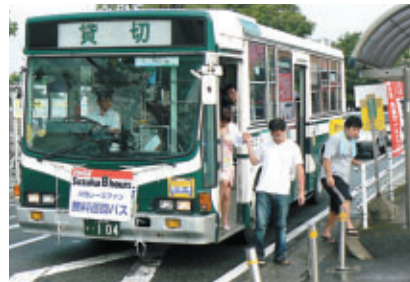
金・土には市内無料循環バスを運行 (主催:鈴鹿商工会議所)