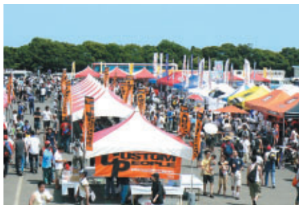
“日本最大・最高のバイクイベント”として開催された二回目の開催となる「MOTO MAX」