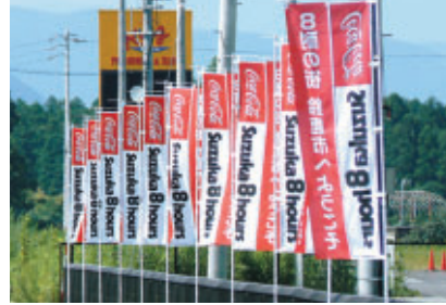
市内各所には歓迎ののぼりが