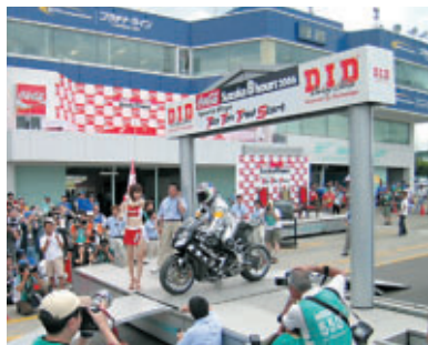
D.I.Dスターティングゲートから トップ10トライアルに出走するライダー達

■ リザルト/レポートの詳細は以下をご参照ください。 www.8tai.com/