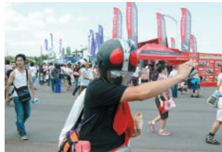
熱心なファンの方です