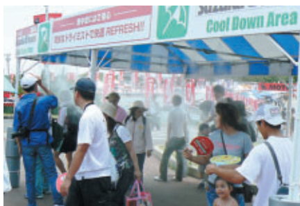
コース周辺各所に設けられた「クールダウンエリア」