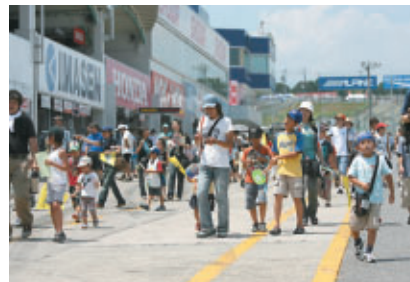
鈴鹿市の親子150名を 公式練習日のピットウォークにご招待