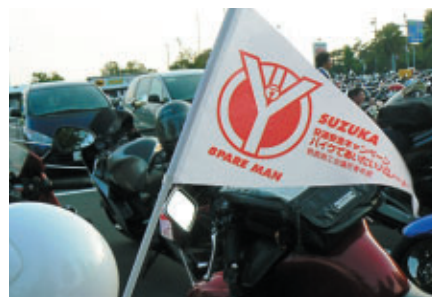
「バイクであいたいパレード」参加の証です