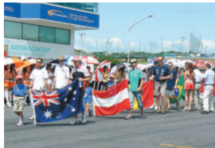
国別対抗戦代表選手と地元の子供達がいっしょに入場