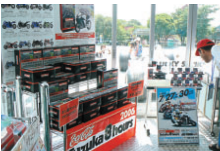
京商からリリースされた昨年の8耐マシン1/32ミニチュアモデル場内では早々と完売