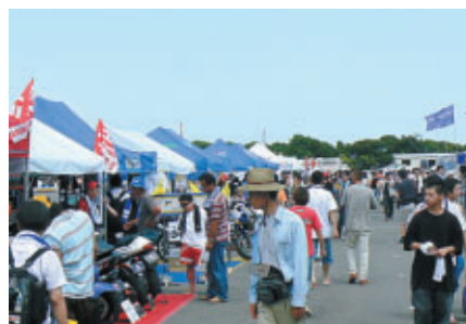
「カスタム・ビレッジ」にはアフターパーツメーカーによる販売ブースが大集合