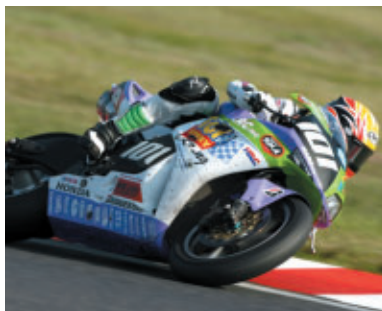
TOY STORY RT RUN'A&HARC-PROが2位に