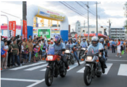
8回目となった「バイクであいたいパレード」 450台以上のバイクが市内からサーキットまでをパレードしました (主催:鈴鹿商工会議所青年部)