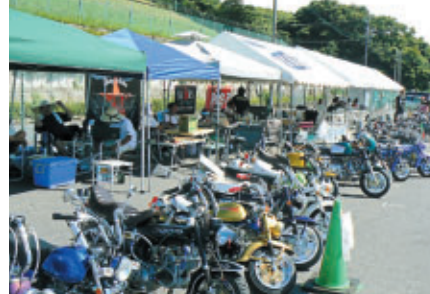
南コースで土曜日に開催された「4MINI/パラダイス」(主催:モトチャンプ誌)