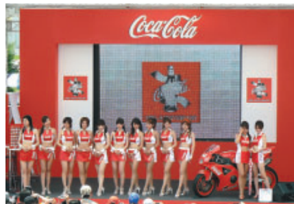
コカ・コーラステージでは数々のイベントを開催