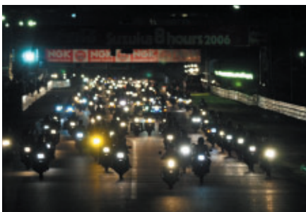
450台以上が参加した「バイクであいたいパレード」