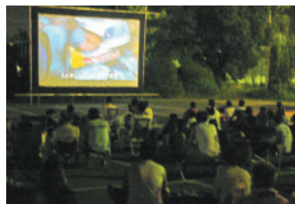
8耐オフィシャルムービーとして今夏公開のV1000のドキュメンタリー映画「ダスト・トゥ・グローリー」を特別上映