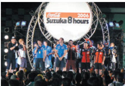
選手たちが明日の決勝への意気込みをファンの目前で語った