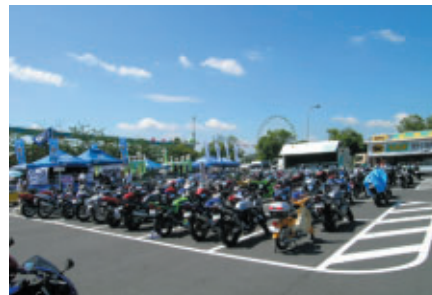
2輪駐車場では、ライダーサービスとしてヤマト運輸による「8耐ヤマトらくらくツーリングバック」やArai/SHOEIによるヘルメットクリーニング・サービスを実施