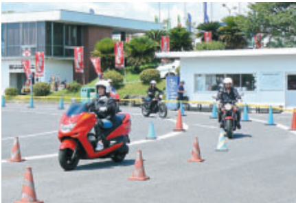
各メーカー新型車を使用しての「NMCAライディングレッスン」