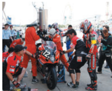
ヨシムラスズキwith JOMOのピット作業