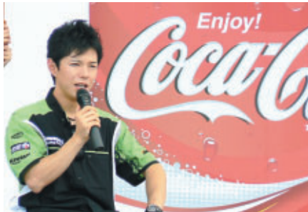
Moto GPで活躍中の中野真矢選手 9月のもてぎでの日本GPに期待しましょう