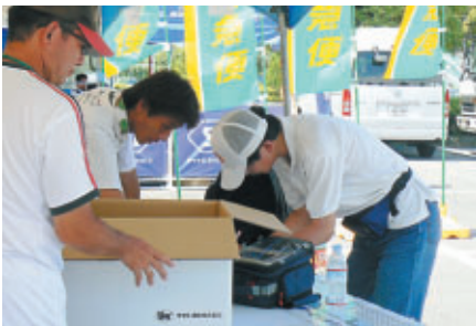
ヤマト便による荷物受取・発送・預かりサービス