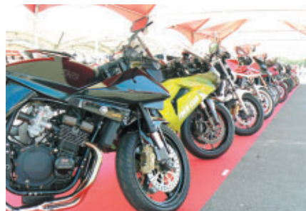
各ショップが腕によりをかけたカスタムマシン・コンテスト (主催:カスタムピープル誌)