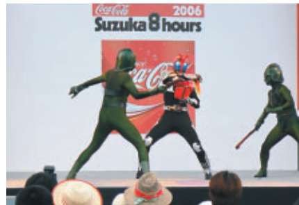
コカ・コーラマルチステージでの仮面ライダーショー