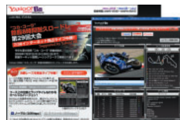
8耐ブロードバンド・サポーター Yahoo!BBによるインターネットライブ配信映像