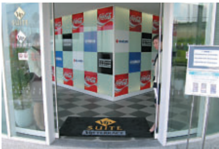
VIPスイート エントランス