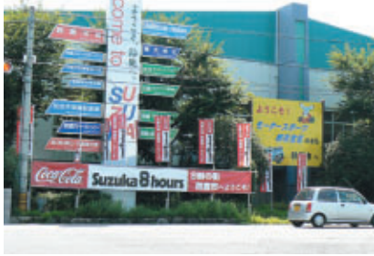
東名阪自動車道 鈴鹿ICにて

地元・鈴鹿市との協力体制なしに”コカ・コーラ”鈴鹿8耐の盛り上がりは考えられません。 今年も全国からお越しのお客さまを温かくおもてなしいたきました。