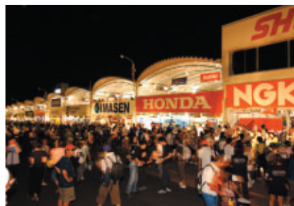
前夜祭の最後には大好評の「ナイトピットウォーク」