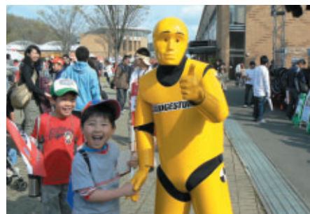
安全啓発活動「Think Before You Drive」キャンペーンの シンボル、ダミー人形君と「ハイ、ポーズ!」(プリヤストンブース)