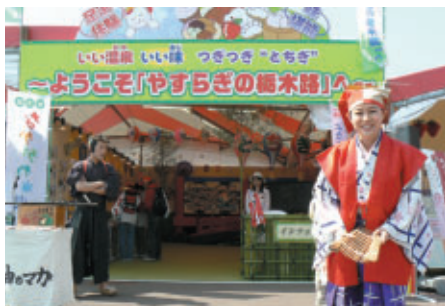
栃木県ブースでは「日光江戸村」の 楽しいパフォーマンスなども