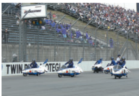
航空自衛隊ブルーインパルスJr.による楽しい展示飛行