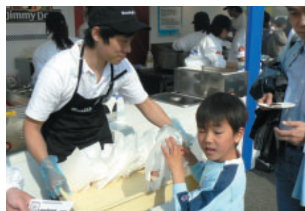
米国食肉輸出連合会「アメリカン・ミートBBQ Village」では アメリカンビーフの試食やアメリカンパークを使った ホットドッグを無料配布(21日)