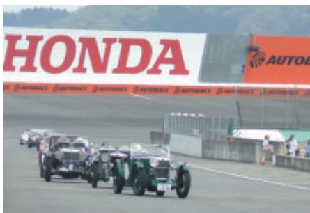
地元のマニアによるクラシックカーパレード」(21日)