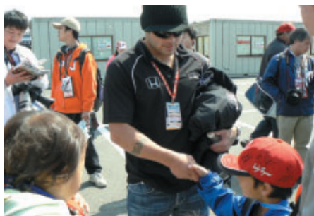
パドックで気軽に選手のサインをもらえちゃう これがアメリカンレース