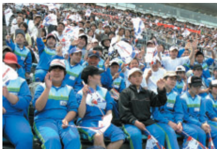
栃木、茨城、岩手の小中高等学校、施設、養護学校をご招待 2328名の児童・生徒が熱い声援を送っていました