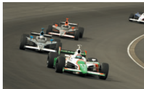
優勝したトニー・カナーン