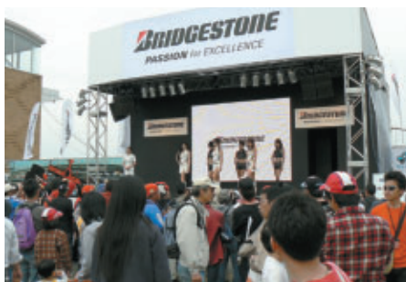
ブリヂストンブースでのステージイベント