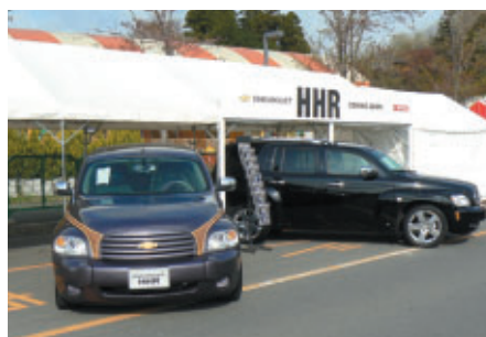
ハマー、シボレーなどアメリカを代表する名車が一堂に会した 「アメリカンCARヴェレッジ」