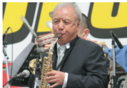
宇都宮出身のジャズプレイヤー渡辺貞夫さんによる国歌吹奏