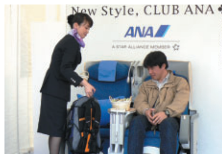
ANAブースでは ゆったりしたフライト気分を体験できるコーナーが