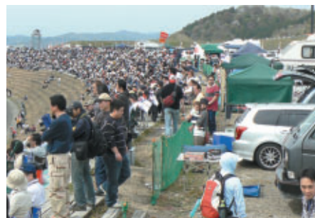
「コースサイドパーキング」では愛車から降りたら即観戦席