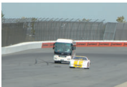
お客さま同乗のストックカーが走る中をバスで遊覧 「スーパースピードウェイバスツアー」(21日)