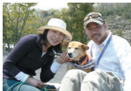
ワンちゃんエリアでは愛犬とゆったり観戦