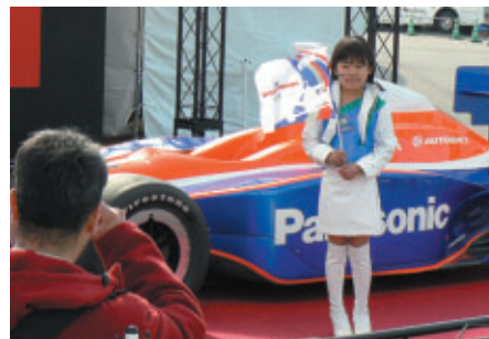
ツインリンクもてぎエンジェルやレーシングドライバーに変身!!