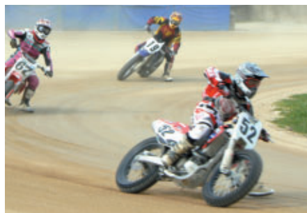
INDY決勝終了後、ダートトラックでは 2輪ダートトラックオールスターレースが行なわれました