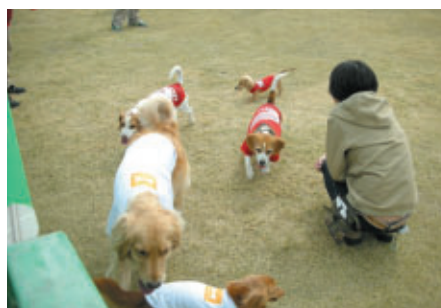
「Honda Dog」特設ドッグランで遊ぶワンちゃん達