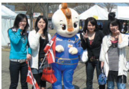
鈴鹿サーキットでおなじみのコチラレーシングが ツインリンクもてぎにデビュー