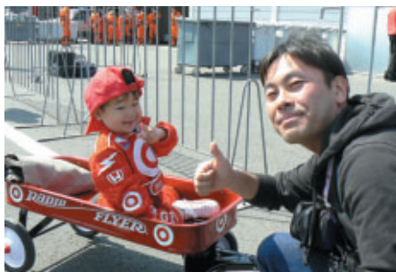
熱心なダン・ウェルドンファンのファミリー