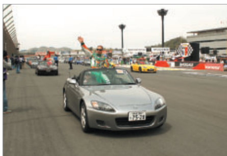
決勝レース前に行なわれた「ドライバーパレード」