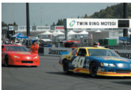
関係者、ゲスト等を対象としたストックカー同乗走行 (21日)