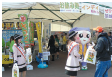
キャラクターや観光親善大使「梅大使」など 華やかな雰囲気茨城県ブース