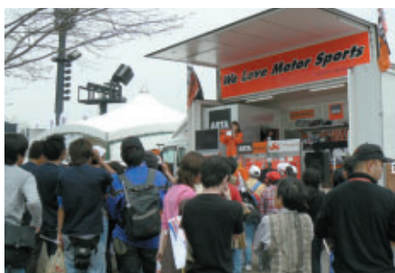
オートボックスブースでのステージイベント