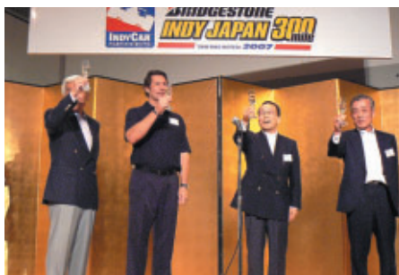
パートナー様、地元関係者様をお招きして行なわれた 「パートナーズレセプション」(20日 ホテルツインリンク)