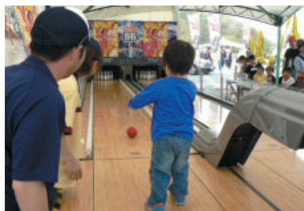
日本ボウリング協会ブースで行なわれた ミニボウリング体験レーン