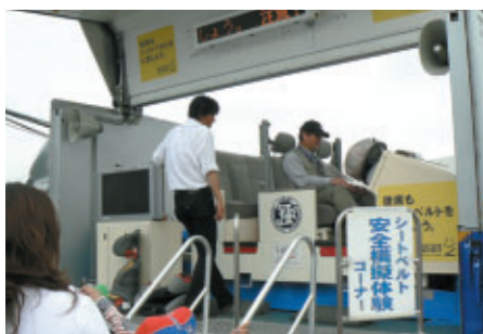
シートベルト効果を体験できる「シートベルトコンビンサー」 (JAFブース)