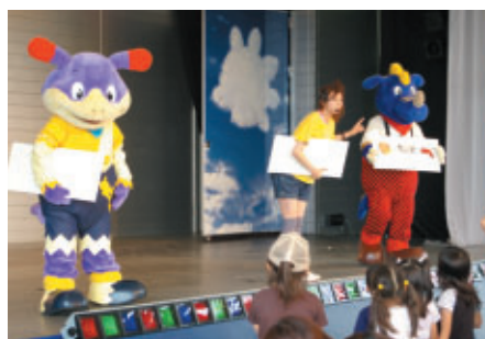
モビステージで行われたコチラファミリーの歌やダンスショー「ブッチキッズのカラフルスマイル」