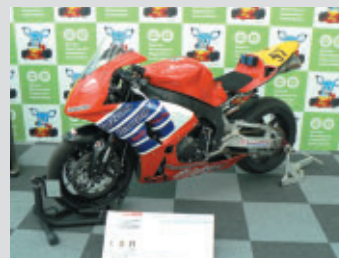
マシン協力: Honda鈴鹿レーシングチーム