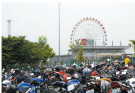
正面ゲートに設けられた2輪駐車場(7日)