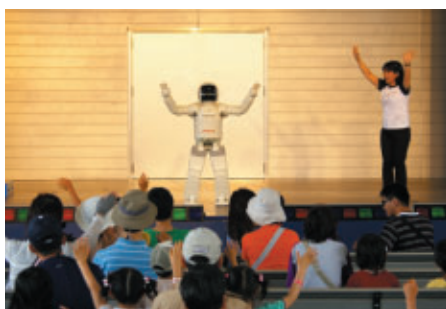
遊園地内モビステージでは新型ASIMOのパフォーマンスショーが行われました