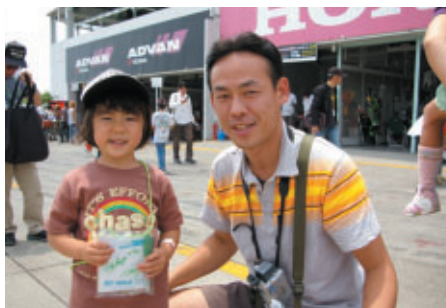
ピットウォークご参加の方にはミニサイン色紙を配布