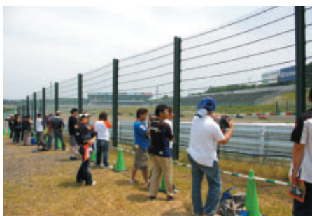
新たに設置されたS字コーナーの「激感エリア」 パドックバスをお持ちの方にお楽しみいただきました