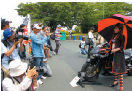
注目を集めたマーシャルバイクHonda DN-01と サーキットクイーンのフォトセッション