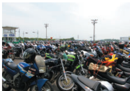
8日はコースに近い交通教育センターエリアに2輪駐車場が設けられました