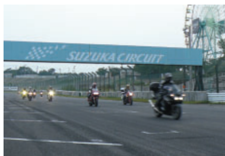
マイバイクでレース終了後のレーシングコースを 無料体験走行いただいた「サーキットクルージング」