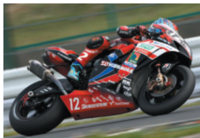
3位のヨシムラスズキwithデンソー-IRIDIUM POWER (渡辺篤選手)