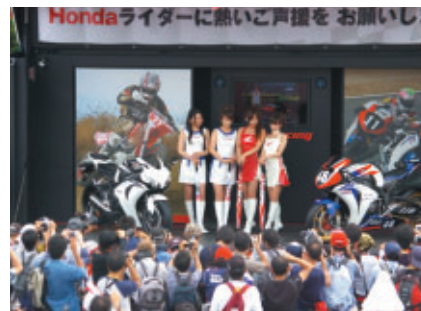
多くのファンが集まったHondaライダーズフレンド撮影会