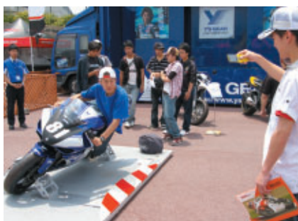
フルバンクしたレーシングマシンのフォトコーナーに注目が集まっていました