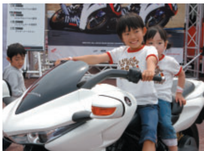
Hondaニューモデルの搭乗体験が人気を呼んでいました