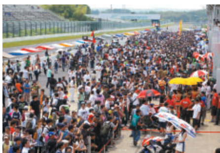
おぜいのお客さまでにぎわったピットウォーク