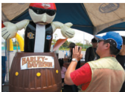
ボタンを押して「ABCバイカー」が飛び出たら Buellオリジナルグラスをプレゼント