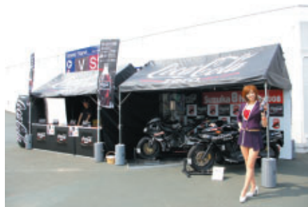
グランドスタンド入り口の「コカ・コーラ ゼロ」鈴鹿8耐ブース マーシャルバイクやコンセプトバイクの展示も行われました