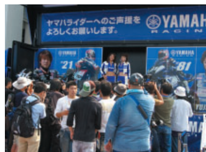
ヤマハイメーガール撮影会に黒山の人だかり