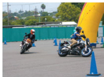
Buellニューモデル試乗会が グランプリスクエア特設会場で実施されました