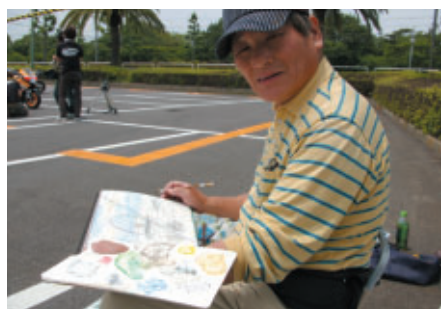
団場で遊園地のスケッチ会にこられたお客さま