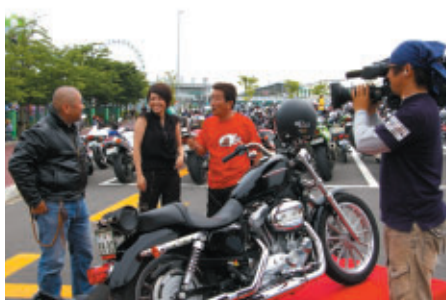
サンテレビのバイク番組「Like a Wind」の収録が行われました(7日)