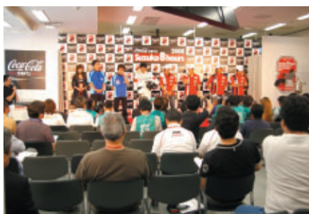
公開形式で行われた「8耐参戦発表会」 各チームの8耐体制発表や意気込みを語っていただきました