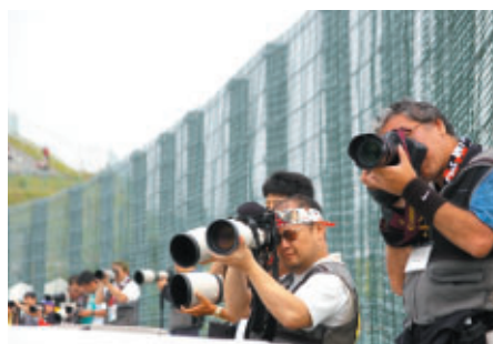
プロカメラマンが指導する「レースカメラマン講座」では コースサイドで迫力の走りに迫れます