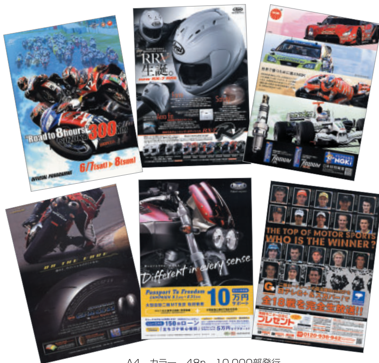
A4 カラー 48p 10,000部発行