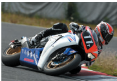
2位のDREAM Honda Racing Team 11 (カルロス・チェカ選手)