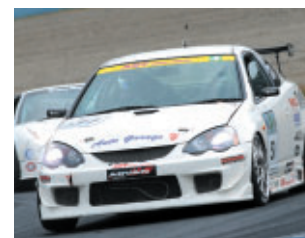
ST4クラス AGY ings インテグラ