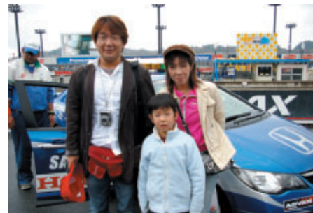
「オーバルバスツアー」参加後、 セーフティカーを前に笑顔のご家族は県内からお越しです