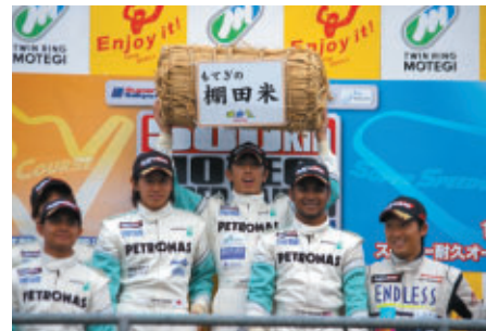
S耐500km、オーバルバトルともにST-1ウィナーには 茂木町から名匠の棚田米が贈られました