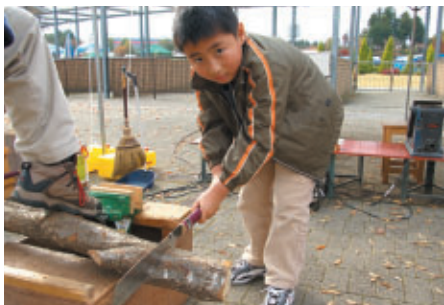
「森のクラフト教室」で お母さんと作品づくりに励んでいた茨城からお越しの坊や お父さんは「レースに夢中」だそうです