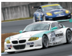
ST1クラス PETRONAS SYNTIUM BMW Z4M COUPE