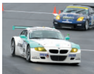
ST1クラス PETRONAS SYNTIUM BMW Z4M COUPE