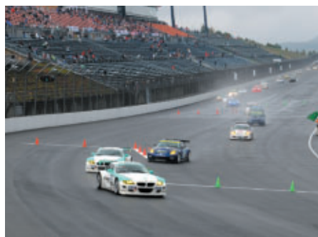
オーバルバトル 第1ヒートスタートシーン