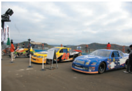
オーバルレースにちなんだ各カテゴリーのマシンがグラนด์スタンドプラザに展示され、注目を集めていました