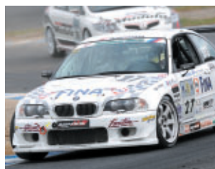
ST3クラス FINA ADVAN M3