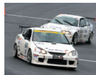
ST4クラス AGY ings インテグラ