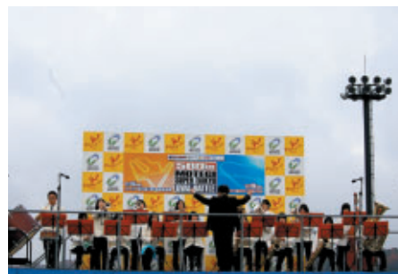
オーバルバトルにささげられて行われた宇都宮商業高校吹奏楽部のみなさんによる国家演奏