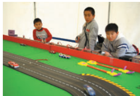
スロットカーでオーバルレーシングを体感！(ファンファンラボ屋外特設ブース)