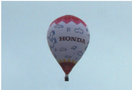
「とちぎ熱気球国際チャンピオンシップ」 (11/20~24)に先がけて飛来した熱気球