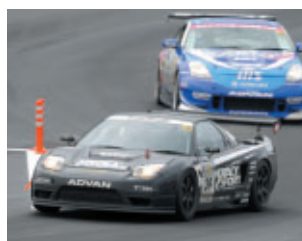
ST3クラス TRACY SPORTS eeiA NSX