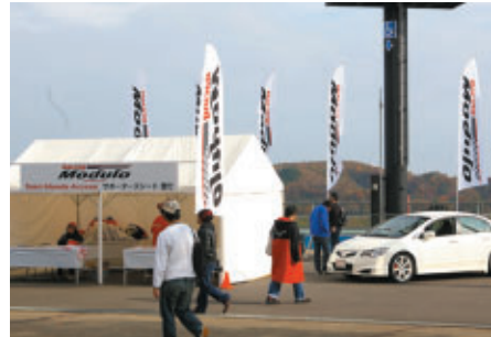
Moduloパーツを装着したHondaシビック タイプRも展示されたホンダアクセスブース