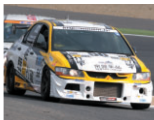
ST2クラス 睡眠打破ランサー