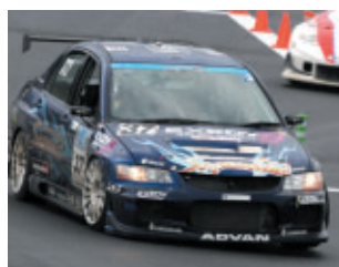
ST2クラス シーケンシャル エンドレス アドバン ランサー