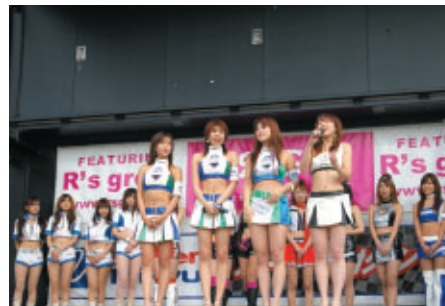
スーパー耐久オフィシャルステージで華やかに開催されたキャンギャルダンスステージ