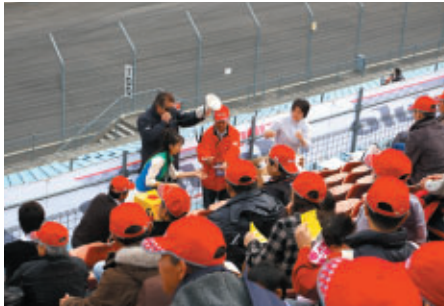
ホンダアクセス応援席で行われた大抽選会

あいにくの天候にたたられた週末でしたが、スーパー耐久初となる「オーバルバトル」の開催などファンの期待もひとしお。ステージイベント、コース上アトラクション、そして場内各所でのイベントが多彩に展開されました。