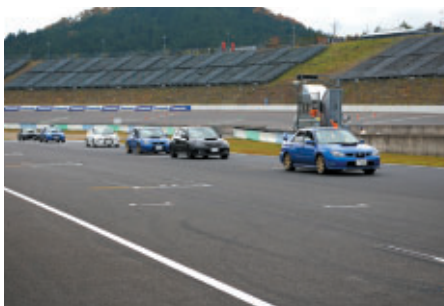
スーパー耐久参戦マシンと同車種でご来場のお客さまを対象に実施されたロードコース体験走行「オーナーズミーティング in S耐」