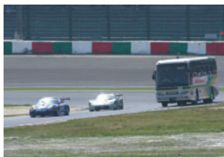
SUPER GTが疾走するコースをバスで遊覧走行「サーキットサファリ」 ホスピタリティラウンジご利用のお客さま（抽選）などにお楽しみいただきました