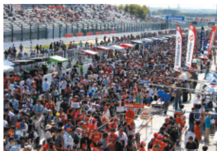
おおぜいのお客さままでにぎわった「ピットウォーク」