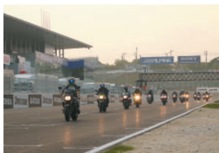
バイクでご来場のお客さまに無料でレーシングコース体験走行をお楽しみいただいた「サーキットクルージング」