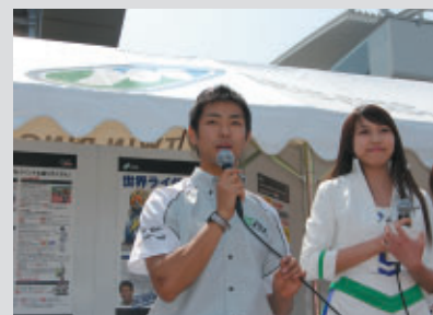
MotoGP PRブースでファンのみなさんに熱い抱負を語りました