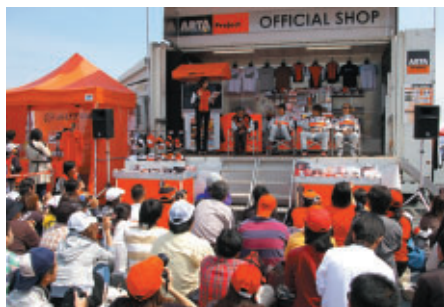
オートバックスブースで行われたドライバートークショー