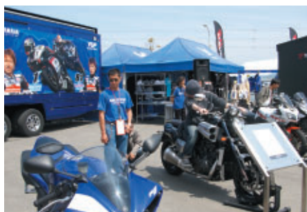
マシン体験搭乗が人気のヤマハブース