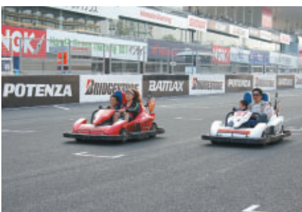
サーキットカートもニューモデルに SUPER GT決勝後に初走行が行われました