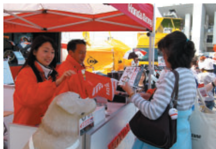
盲導犬チャリティが行われたHondaブース