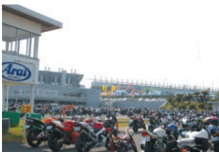
グランドスタンドにほど近い交通教育センターに設けられた 2輪専用駐車場