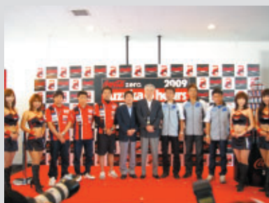
関係者が一堂に会して記念写真

32回目を迎える「コカ・コーラ ゼロ」鈴鹿8耐（7月26日）の記者発表会が4月18日（土）、ピットビル2Fホスピタリティラウンジの一室で行われ、大会の概要が発表されました。