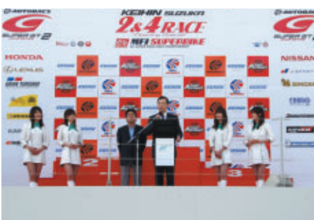
SUPER GT決勝に先立って行われたオープニングセレモニー