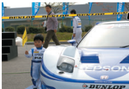
ダンロップブースでEPSON NSXドライバーになりきり!