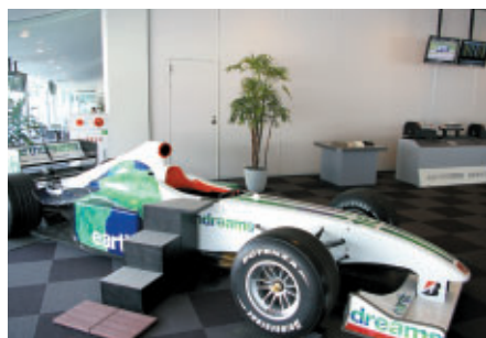
F1ショーカー展示などアトラクション満載のご家族連れホスピタリティラウンジ 「ファミリーラウンジ」(ピットビル2F)