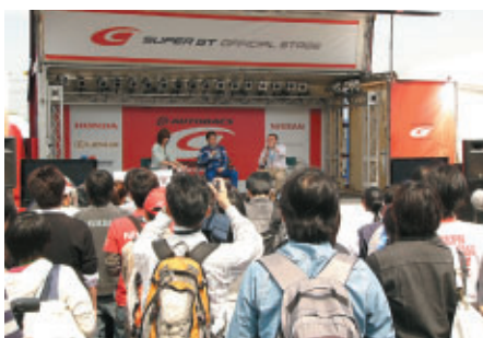
さまざまなイベントが展開されたGTオフィシャルステージ