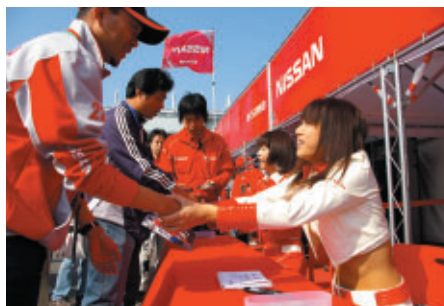
ニスモブースで行われたキャンペーンガールサイン会