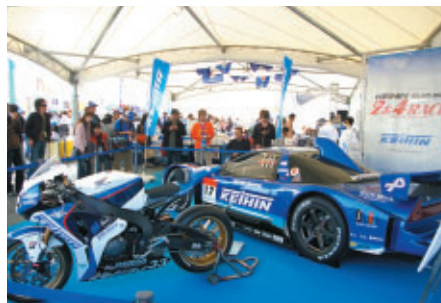
PRブース内に展示されたサポートチームのマシン