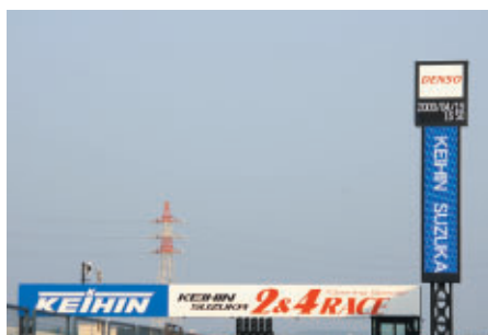
ホームストレートに掲出されたタイトルブリッジ