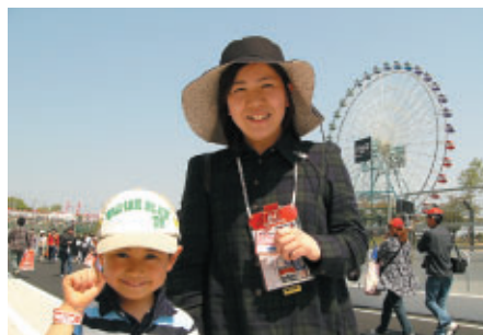
長野からお越しのお客さま 「車で2時間ちょっと、けっこう近いですよ!高速も安くなったし」