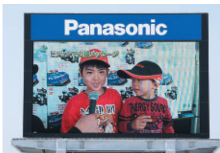
「ファミ得チケット」ご購入のお客さまの中から抽選で放送室からファンの選手に声援を送っていただきました