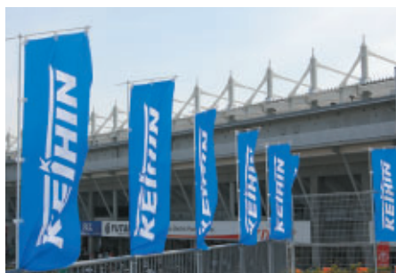
場内をあざやかなブルーで彩ったのぼり