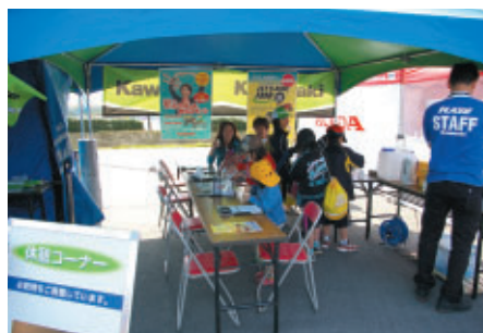
無料休憩コーナーが設けられたカワサキブース