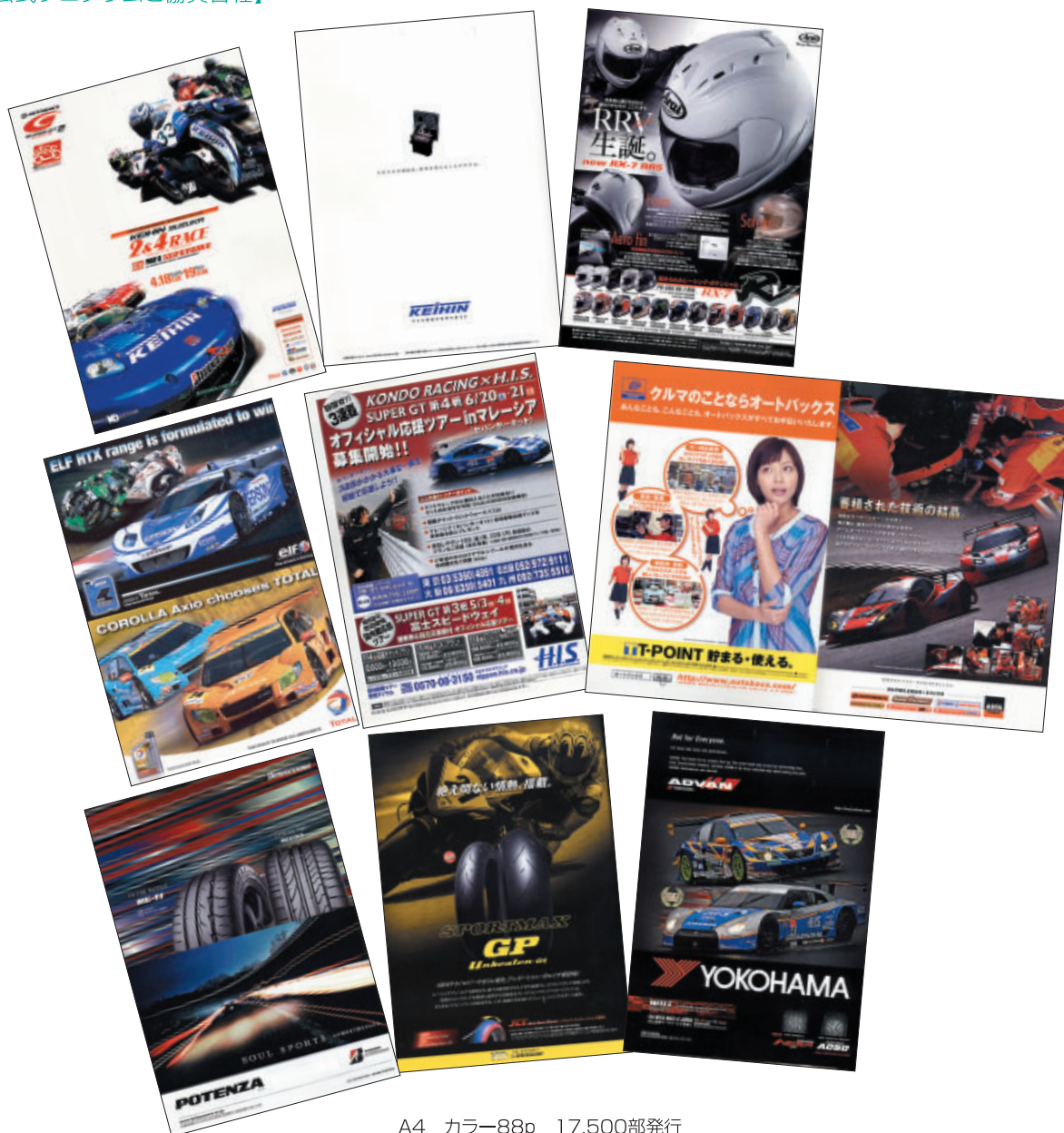
A4 カラー88p 17,500部発行

株式会社アライヘルメット 株式会社アイデア 株式会社エイチ・アイ・エス 株式会社オートボックスセブン 株式会社ケービン 株式会社三栄書房 株式会社三推社