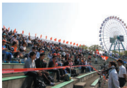
Hondaマシンを駆る2輪・4輪選手がHondaファンシートを訪問