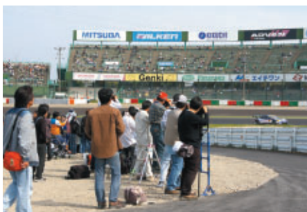
パドックバスをお持ちの方を対象としたコースサイド観戦エリア 「激感エリア」