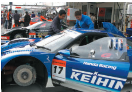
ピットワークスタイルでパドックバスをお持ちの方対象に実施された「オープンピット&公開車検」