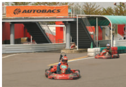
オリジナルライセンスカードやタイムに応じて記念品がもらえるレーシングカート体験イベント(モータースポーツランド)