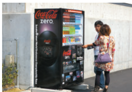
こちらもリニューアル 「コカ・コーラ ゼロ」鈴鹿8耐仕様自販機