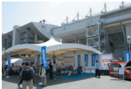
GPスクエアに設置されたPRブース

新生鈴鹿サーキットの記念すべきオープニングを飾った本大会は、2輪・4輪などの各種部品、システムの開発、製造、販売により、国際的な知名度を誇る株式会社ケーヒン様の冠ご協賛をいただき、より華やかなイベントとなりました。