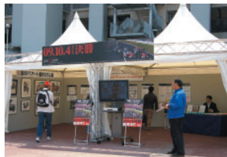
3年ぶりに鈴鹿に帰ってくるF1日本GP紹介ブース