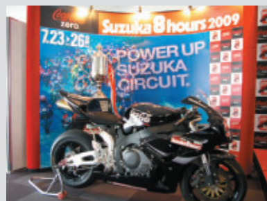
「POWER UP SUZUKA CIRCUIT.」をキーワードに様々な施策が予定されています