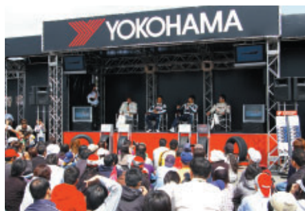
ADVANブースで行われたドライバートークショー