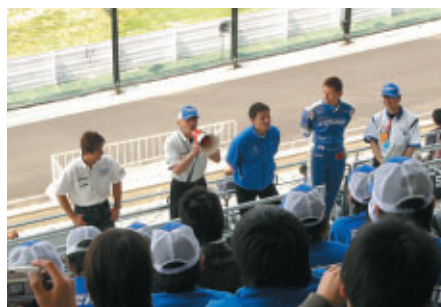
決勝レースを前にグランドスタンドV2席に設けられたケーヒン応援席をサポートチームの監督・選手が訪問