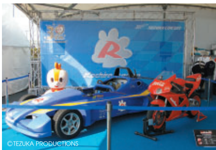
子どもたちに人気のコチラレーシングファンクラブブース