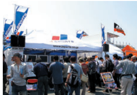
SUPER GTオフィシャルTV J SPORTSブース