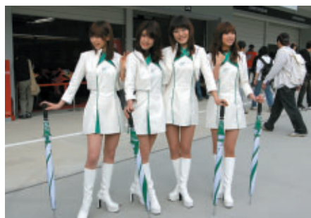
こちらもリニューアル サーキットクイーンたちの新コスチューム