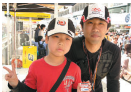
愛知県弥富市からお越しのお客さま 「グランドスタンドに大屋根がついてすごいです!」