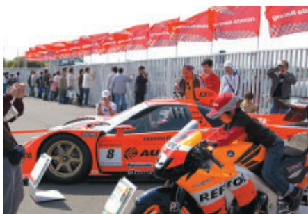
Hondaファンシート入り口に設けられたSUPER GT仕様NSXと MotoGPマシンRC212Vの搭乗体験コーナー