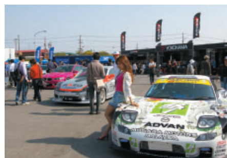
有名ショップの手によるチューニングカーを展示