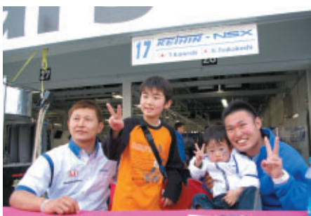
中学生以下のお子さま同伴の方に無料で楽しみたいだいた「キッズワーク」