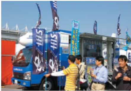
移動旅行相談車が併設されたHISブース