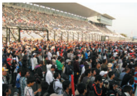
SUPER GT表彰式はホームストレートを開放し、お楽しみいただきました