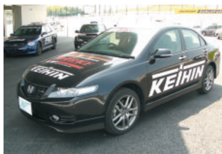
ケーヒンロゴに身をまとったマーシャルカー