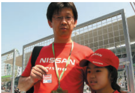
神奈川県からお越しのお客さま 「グランドスタンドがきれいになってびっくりしました」