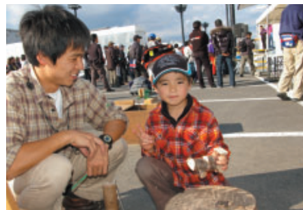
木の枝や木の実を加工しながらオリジナルアクセサリーなどを 体験製作できる「ハローウッズ 森のクラフト教室」もパドックに