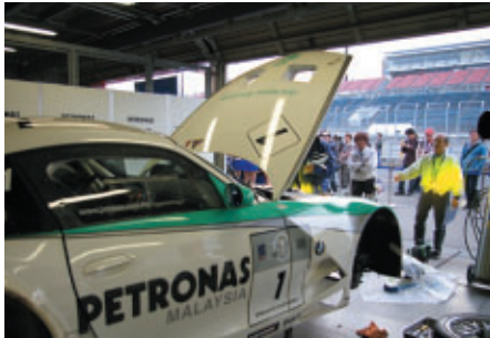
大会前日の27日(金)に 無料ピットウォークスタイルで行われた公開車検

本格的なモータースポーツシーズンも大づめを迎え、名残りを惜しむように多くのファンがツインリンクもてぎにつめかけました。今回小学生以下にはパドックへ無料でご入場いただき、穏やかな気候のもと数々のイベントをお楽しみいただきました。