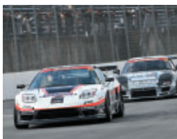
ST3クラス 5ZIGEN NSX