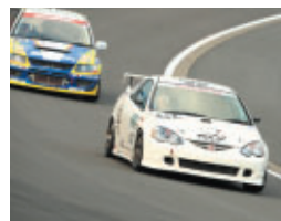
ST4クラス ホンダカーズ東京μSSR DC5