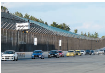
スーパー耐久参戦マシンのベース車両によるオーナーズパレード