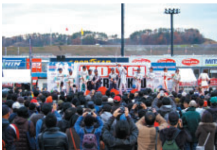
コース上を開放して行われた第2レース表彰式