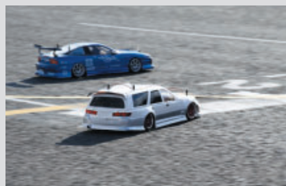
本物さながらの激しい走り