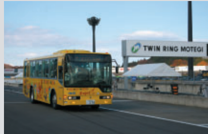
スーパースピードウェイをバスで体験走行