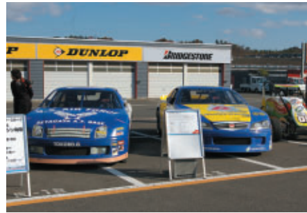
アメリカンモータースポーツマシンがパドックに大集合 迫力のエンジン始動体験も行われました