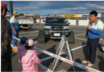
レースを支えるクルマたちをパドックに展示 説明や実演も行われました