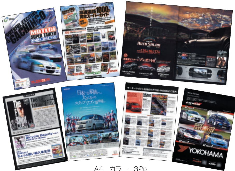
A4 カラー 32p

株式会社講談社ビーシー 株式会社三栄書房 株式会社三推社 株式会社二玄社 本田技研工業株式会社 モーターマガジン社 横浜ゴム株式会社