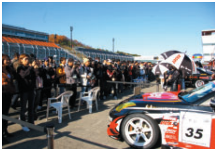
おおぜいのお客さまでにぎわったピットウォーク