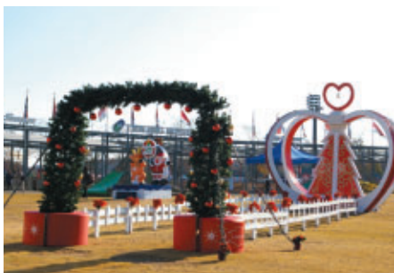
ツインリンクもてぎもクリスマスムードいっぱい 冬もさまざまなイベントをご用意しています