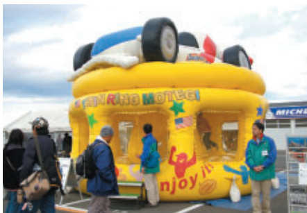
楽しい「インディふあふあ」がパドックに登場 子どもたちの人気の的でした