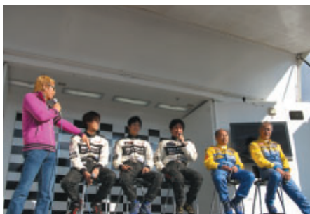
パドック内特設ステージで行われた ST-4クラスドライバートークショー