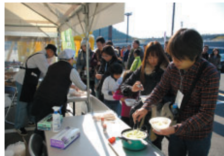
茂木町のご協力により先着200名様に 地元産の食材をふんだんに使った「美土里野菜汁」が 無料でふるまわれました