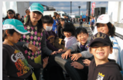
ホンモノのレーシングタイヤに触れて大感激!

PICK UP2 いま人気絶頂のドリフトラジコン(ラジドリ)、ロードコース上に特設コースを設定、ラジコン関連企業各社様のご協力・ご協賛をへて華やかに開催されました。