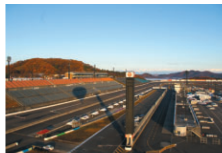
熱気球からのツインリンクもてぎの眺望です