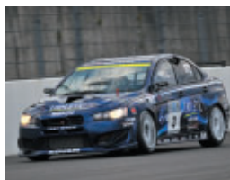
ST2クラス ENDLESS ADVAN CS・X