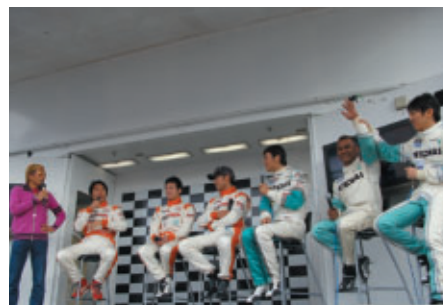
こちらはST-1クラスドライバートークショー