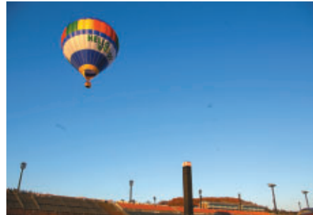
ツインリンクもてぎを上空から堪能 熱気球体験