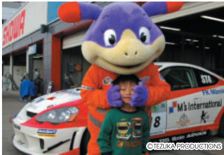
今回もコチラレーシングの仲間が各種イベントで大活躍!