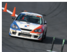
ST4クラス M'sインターナショナル コスモニックFK ings DC5