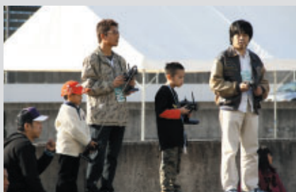
子どもから大人まで 腕自慢たちが熱い戦いを展開