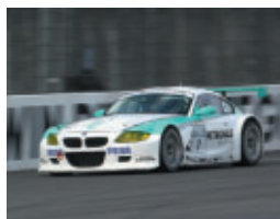
ST1クラス PETRONAS SYNTIUM Z4M COUPE