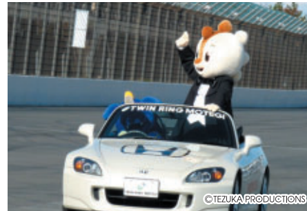
オープニングセレモニーのコチラはタキシードで登場