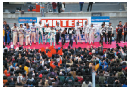
最後に全選手が参加しての「サンクスフィナーレ」 来年もよろしく!