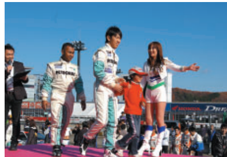
スーパースピードウェイ特設ステージで行われた オープニングセレモニーでは子どもたちが選手をエスコート