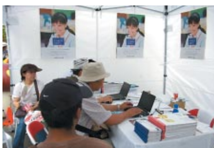
お客さまの保険内容をオンラインで即診断 (アメリカンホームダイレクトブース)