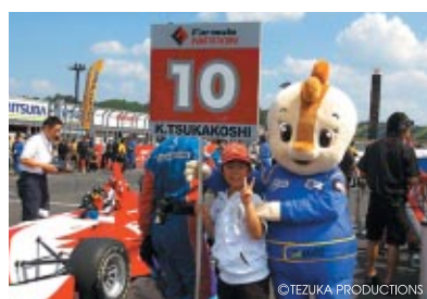
事前公募で選ばれた皆さんにグリッドキッズをつとめていただきました