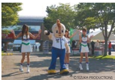
ゲートオープンと同時にコチラとツインリンクもてぎエンジェルがダンスでお出迎え