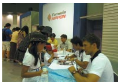
ファンファンラボで行われた全ドライバーによるサイン会抽選で選ばれた幸運な50名のお客さまが参加しました