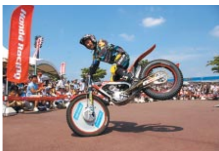
スーパーテクニックが観客を魅了した 「Honda トライアルバイクショー」