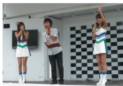
ツインリンクもてぎエンジェルによる 「ツインリンクもてぎPRステージ」