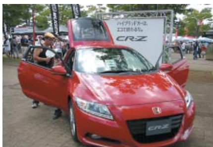
四輪・二輪のHondaニューモデルが多数展示されました

大会期間中、ツインリンクもてぎ場内一円では「みて」「あそんで」「体験できる」イベント Enjoy Hondaが開催されました。