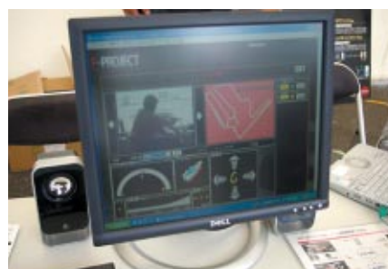
マシンに搭載された映像・データ・音声をリアルタイムで 送信するシステムを公開 (NTTドコモブース)