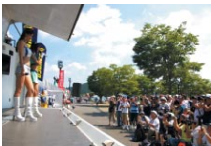
各チームのキャンペーンガールが一堂に会した 「キャンペーンガールオンステージ」