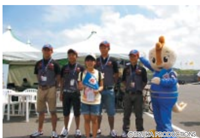
コチラレーシングが応援するFCJドライバーを子どもたちが訪問しました