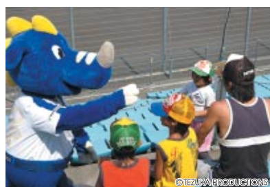
グランドスタンドに設けられた「コチラレーシングシート」をコチラファミリーが訪問