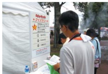
イベント会場を回り、クイズに答えて賞品をゲット 「Enjoy Hondaクイズラリー」