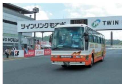
ロードコースをバスでご体験いただいた「レーシングコースバスツアー」 7日(土)には中嶋悟監督、手塚長孝監督のガイドでお楽しみいただきました