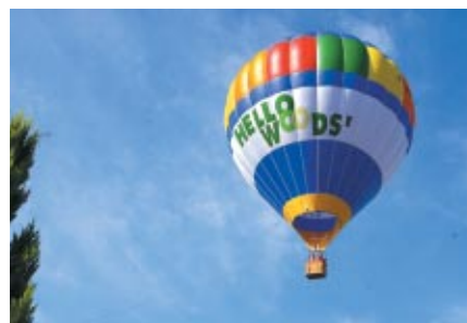
ハローウッズで行われた「熱気球係留体験フライト」