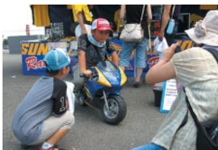
SUNOCOカラーのポケバイは子どもたちに大人気 (SUNOCOブース)