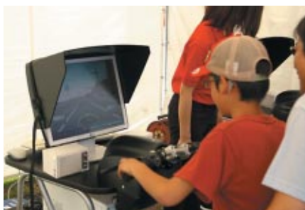
二輪の安全な走行ノウハウを疑似体験いただいた 「ライディングシミュレーター」