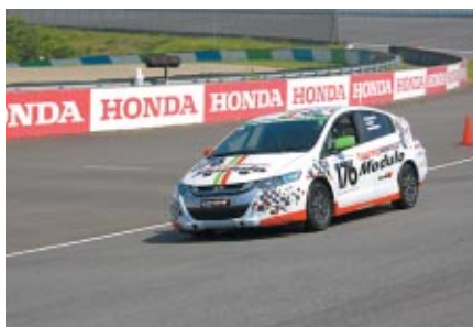
スーパースピードウェイをコースに行われた Moduloカスタムパーツ装着車試乗会