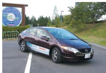
次世代エネルギーとして注目されている 水素電池搭載車「FCXクラリティ」同乗体験