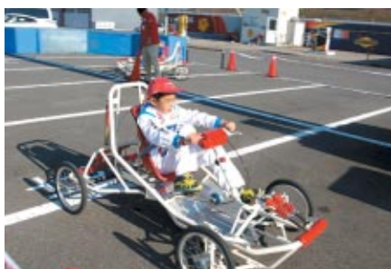
足こぎ式の「ファンカート」走行体験をパドック内特設コースでお楽しみいただきました