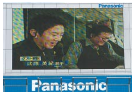
武藤選手には場内実況の解説もつとめていただきました