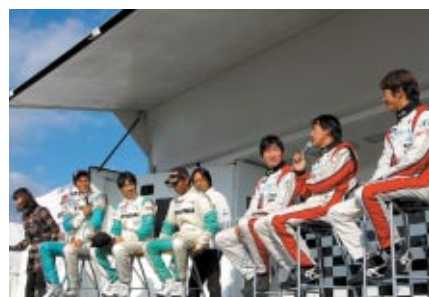
第1レースと第2レースの合間にパドック内特設ステージで行われたドライバートークショー