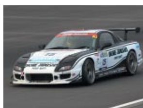
ST-3クラス 岡部自動車ディクセルIWASAKI RX-7