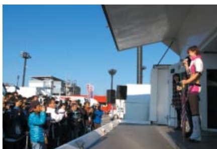
パドック内特設ステージで行われた「キャンペーンガールオンステージ」