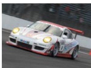
ST-1クラス ART TASTE GT3