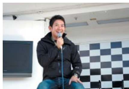
インディカーシリーズで活躍する武藤英紀選手がパドック内特設ステージでオーバルレースの魅力語りしました