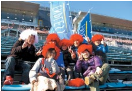
グランドスタンドで氣勢を上げていたのはエンドレス応援団