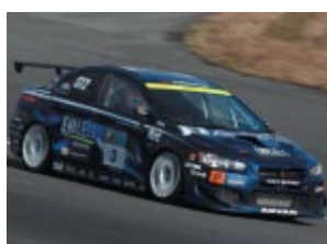
ST-2クラス エンドレス・アドバン・コルトスピードX