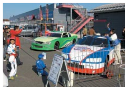
アメリカンモータースポーツマシンがパドックに大集合。迫力のエンジン始動実演(写真)にはお客さまもびっくり