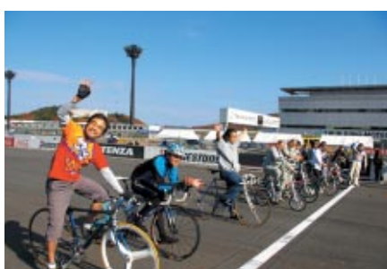
チーム関係者対抗でスーパースピードウェイを舞台に行われた 「モータースポーツチャンネルwith スーパー耐久mobile賞 スーパー耐久オーバルバトル自転車レース」