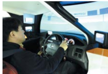
スーパースピードウェイトタイムアタックに挑戦できる 「ドライビングシミュレーター」(ファンファンラボ)