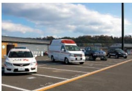
レースで働くクルマたちがパドックに展示され、役割説明や実演も行われました