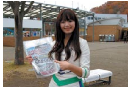
早くも来年の「インディジャパン」(9/18決勝)を ツインリンクもてぎエンジェルが笑顔でPR