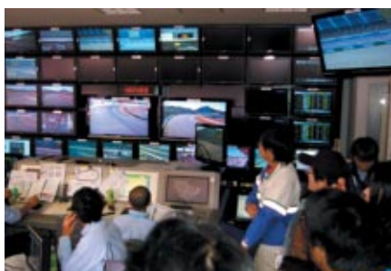
ふだんは入れないレース運営の中枢を お客さまにご覧いただいた「コントロールタワー見学ツアー」