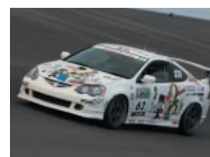
ST-4クラス ホンダカーズ東京G/Mインテグラ