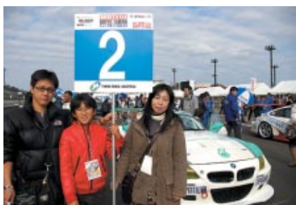
スタート前の各マシンをエスコートいただいた 「グリッドファミリー」