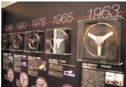
歴代レーシングマシンのステアリングを通じて Hondaのモノ造りへのこだわりを紹介した 「ステアリングホイール展“挑戦の始まり”」(Honda Collection Hall)