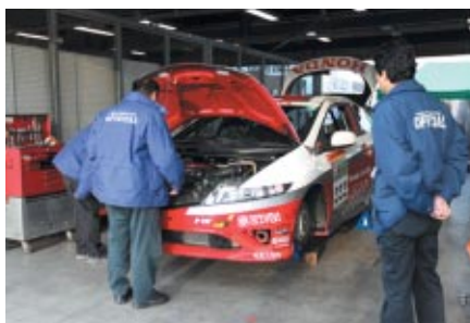
大会前日の26日(金)に無料ピットウォークスタイルで行われた公開車検

スーパー耐久シーズンエンドを飾った一戦は、すっかり恒例となった晩秋の「オーバルバトル」。今回はパドックエリアを小学生以下には無料でご入場いただくなど数々のイベントを気軽にお楽しみいただきました。