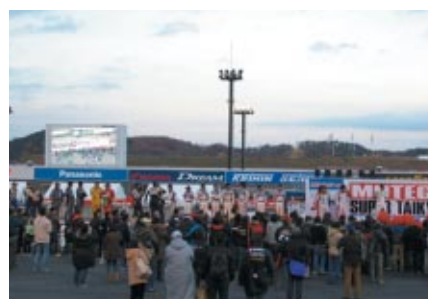
全スケジュール終了後にコースを開放して行われた 「Thanks! ファイナル」 特設ステージから全選手が声援にこたえました