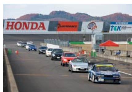
「S耐観戦プラン」「S耐満喫プラン」の各プランでご来場いただいた お客さまを対象としたスーパースピードウェイパレード走行 160台以上の盛況ぶりでした