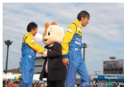
第1レースに先がけての「オープニングセレモニー」 各選手がステージ上でコチラとがっちり握手