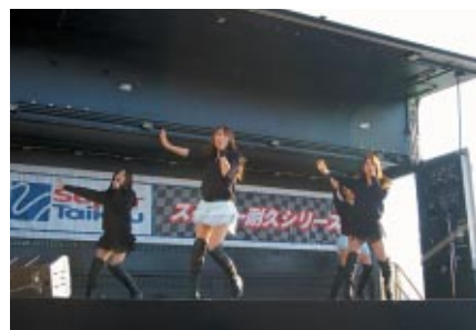
グランドスタンドプラザ特設ステージではスーパー耐久イメージガールのJUICYミニライブ(写真)やキャンギャルオンステージなどが行われました