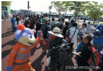
土曜の朝にスタッフやコチラファミリーがお客さまをお出迎えした「ウェルカムセレモニー」