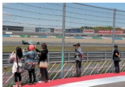
迫力の走りを間近で体験いただいた「激感エリア」(写真は1・2コーナーイン側)