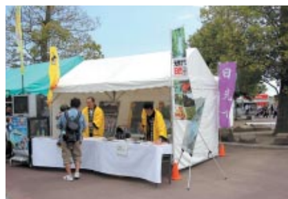
栃木県日光市の観光や物産が紹介された日光市ブース