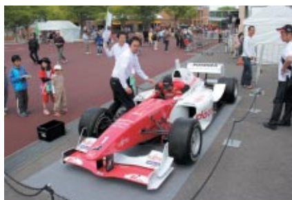
フォーミュラ・ニッポンブースではフォーミュラ・ニッポンマシン(FN06)の搭乗体験が人気を呼んでいました