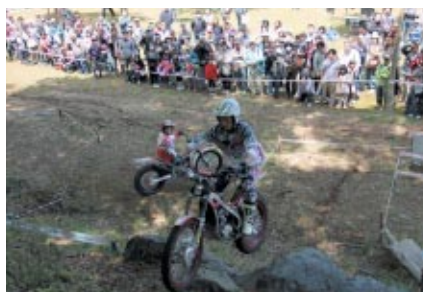
6/2・3に行われるトライアル世界選手権「日本グランプリ」に先駆けて、スーパーテクニックをご覧いただいた「トライアルデモンストレーション」