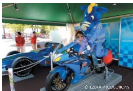
コチラレーシングブースでは2輪・4輪マシン搭乗体験が実施されました