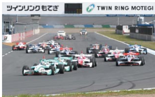
フォーミュラ・ニッポン スタートシーン