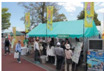
栃木県那須塩原市の観光や物産が紹介された那須塩原市ブース