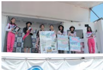
茨城県、日光市、那須塩原市のゆるキャラや観光大使が出演して行われた「地元行政PRステージ」