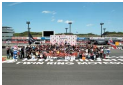
「サポーターズシート」ご購入のお客さまは、応援している選手とのフォトセッションにご参加いただきました