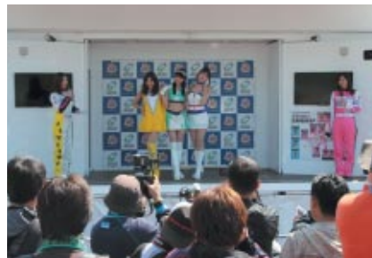
各チームのキャンペーンガールがせいぞろいした「キャンギャルオンステージ」