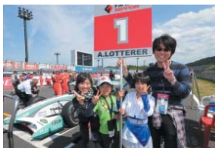
決勝レースのスターティンググリッドをエスコートいただいた「グリッドボードキッズ」