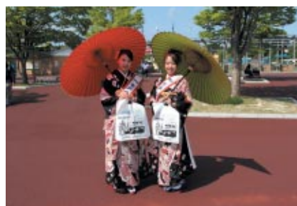
「水戸の梅大使」が水戸市をはじめ城県のPRに大活躍でした