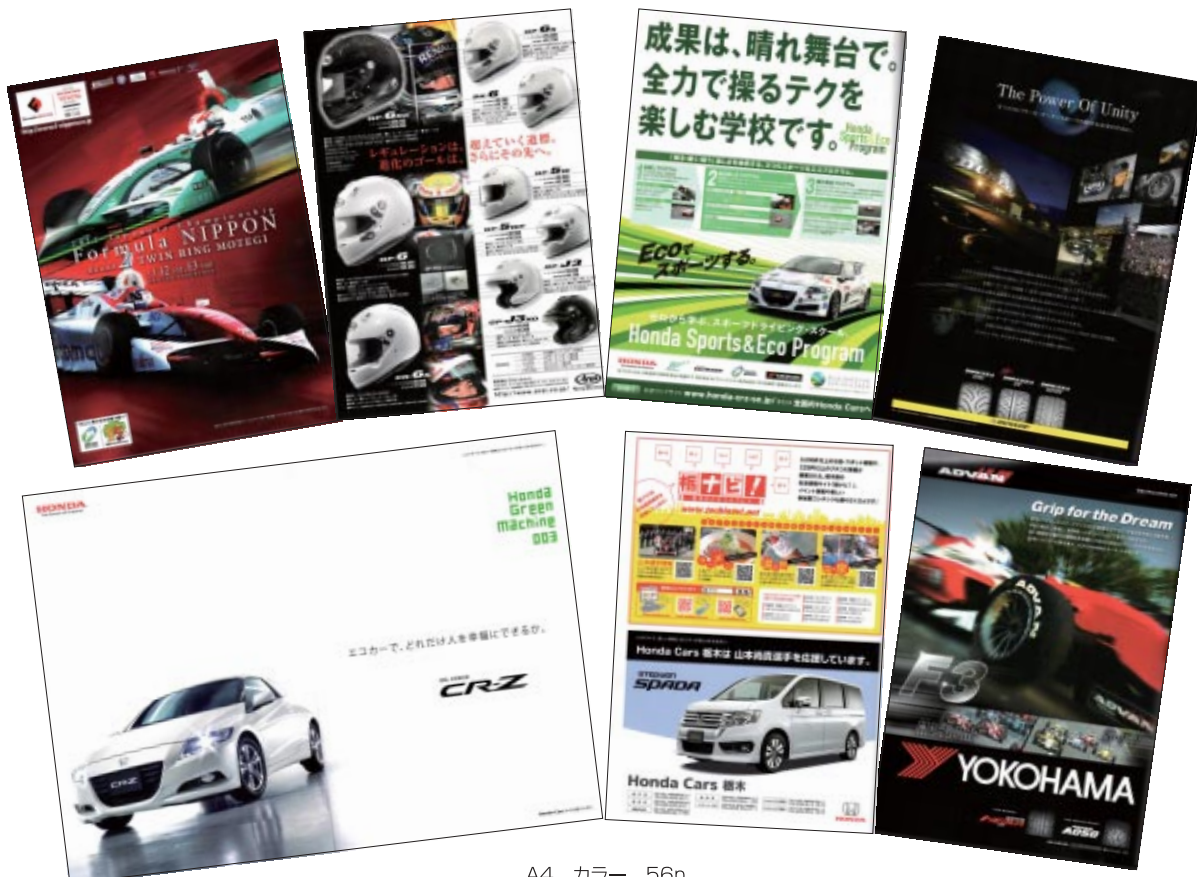
A4 カラー 56p 12,000部発行