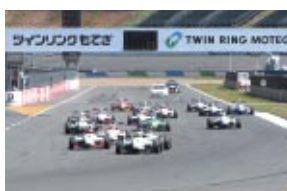
第3戦 平川 亮 FTRSクラリオン広島トヨペットFCJ