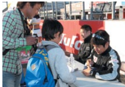
中学生以下のお子さま連れのお客さま限定で行われた「ドライバーサイン会」