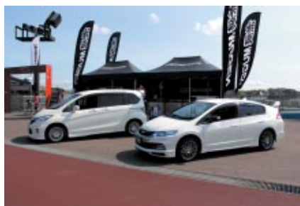
無限ブランドのスペシャルパーツやカスタムカーの展示が行われたM-TECブース

ツインリンクもてぎ開業15周年記念大会として行われた今回のフォーミュラ・ニッポン。大会期間中は、おだやかな春の気候に恵まれ、多くのお客さまにレースとイベントをお楽しみいただきました。