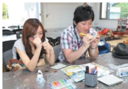
チョコQのオリジナルペインティングや専用コース、スペシャルゲームも楽しめる「チョコQペイントファクトリー」(Honda Collection Hall)