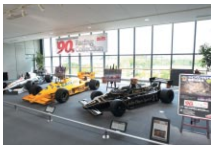
中嶋悟選手がドライブした最後のF1「ティレル020」などが展示された「'90s racing Collection」(Honda Collection Hall)