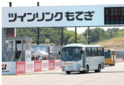
「プレミアムスイート」ご購入のお客さまを対象に行われたロードコースバス走行