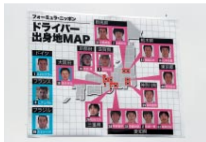
お客さまと同じ出身県のドライバーが好成績を取ると特典がゲットできる「みんなの代表ドライバー応援バトル!」を実施しました