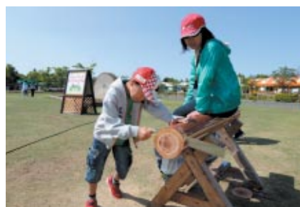
アウトドアライブをご体験いただいた「ハローウッズたいけんひろば」