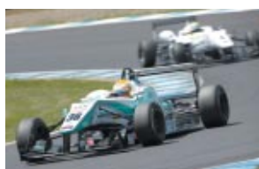
第4戦 中山雄一 PETRONAS TEAM TOM'S