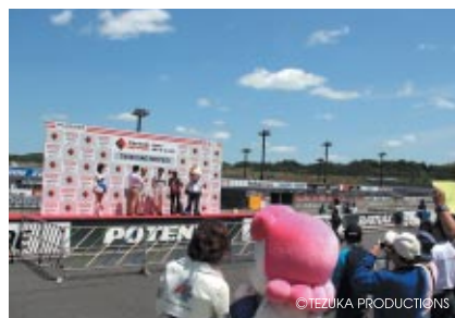
決勝レースを前に表彰ステージで行われた選手紹介