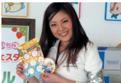
ツインリンクもてぎで開催されるビッグレースを3回以上観戦すると 11/24(土)もしくは12/31(月)の「花火の祭典」がお車1台分 (定員まで) 入場無料になる「コチラレーシングのステッカー キャンペーン」を実施中です