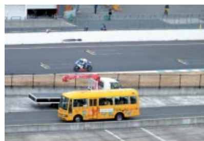
レーシングマシンが疾走するコース沿いのサービスロードをバスでお楽しみいただきました