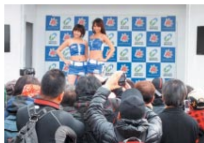
グランドスタンド特設ステージで華やかに開催された 「キャンギャルオンステージ」