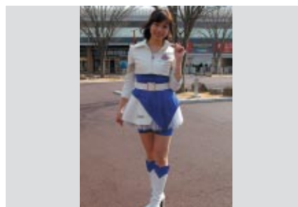
開業15周年を記念してツインリンクもてぎエンジェルの コスチュームもリニューアルされました