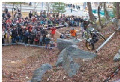
2007、2010トライアル全日本チャンピオン小川友幸選手が場内に設けられた特設セクションを舞台にスーパーテクニックを披露しました