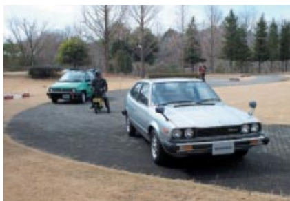
Honda Collection Hall所蔵車両の実走行をお楽しみいただく 「ウィークエンドラン」 初代アコード、モトコンボ、シテカプリオレ (前から) が元気な姿を見せました