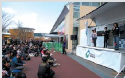
グランドスタンドプラザ特設ステージでのイベント風景

バイクでご来場のお客さまを対象にした豪華プレゼントなど大盛況のうちに開催されました。