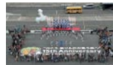
15周年ロゴを中心としてお客様参加による集合写真

今年開業15周年を迎えるツインリンクもてぎ。モータースポーツの本格的な開幕を迎える本大会の初日、3月31日(土)を「家族みんなのモータースポーツ開幕祭」として、家族でご来場の方、バイクでご来場の方全員の入場・駐車、さらにレース観戦を無料でお楽しみいただいたほか多彩なイベントを展開しました。