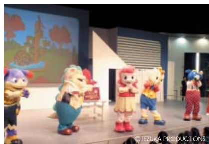
コチラファミリーのチララちゃんは4月4日がお誕生日 ファミリーのみんなとお友だちでのお祝いイベントが ファンファンラボで行われました