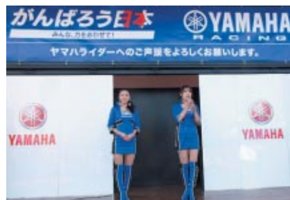
Yamahaブースで行われたキャンペーンガール撮影会