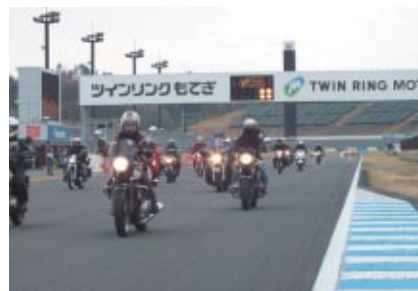
レース終了後、熱戦の余韻が残るコースをマイバイクで無料体験走行 いただいた「フィナーレパレード」