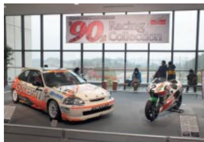
ツインリンクもてぎが開業した1997年に活躍した2台のマシン シビックタイプRとNSR250をHonda Collection Hallに 展示中です(4/29<日>まで)