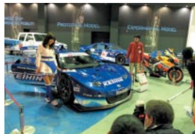
4輪・2輪の各カテゴリーのレーシングマシンがファンファンラボに大集合! 搭乗体験や選手との記念写真をお楽しみいただきました