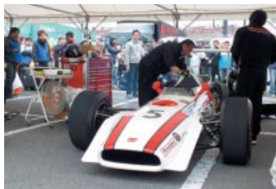
Honda Collection Hall所蔵マシンのデモランは、あいにくの雨のため中止となりましたが、パドックエリアでエンジン始動が行われ、華やかなサウンドをご堪能いただきました。