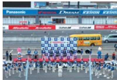
オープニングセレモニーで素晴らしい演奏を披露したのは、茨城県立大洗高等学校マーチングバンド部「BLUE-HAWKS」