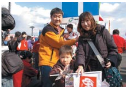
JSB1000クラスのグリッドを親子連れのお客さまにエスコート いただきました