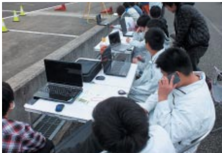
ピットクルーはパソコンでデータ解析しながら、ドライバーとの交信など本格的な耐久レースさながらの緊張感です。