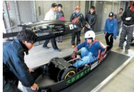
公式車検は、ドライバーの体重測定や装備確認、車両の安全チェックなどが行われました。