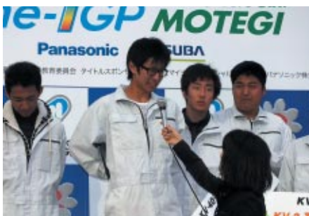
KV-2クラス総合優勝の長野OIDE長姫高校 原動機部。「みんなが一丸となって、やるだけやろうと頑張った成果」とチームワークを強調。