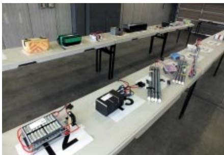
車検後の走行前と競技のインターバルには駆動用電池「パナソニック エボルタ HHR-3MWS」をオフィシャルが保管します。