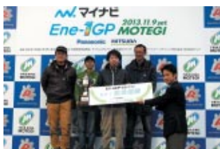
パナソニック株式会社