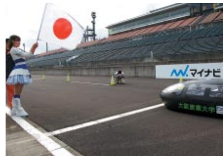
午前中に行われたのは、一台ずつ走行し一周のタイムを競う「ONE LAPタイムアタック」。