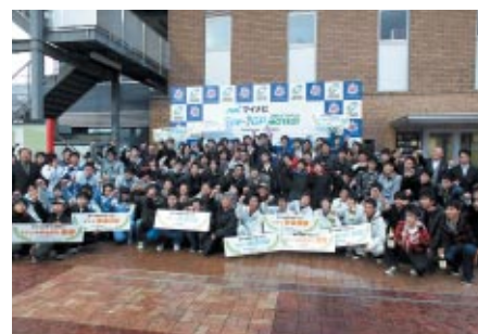
イベントのフィナーレは全員での記念撮影。また来年もツインリンクもてぎで会いましょう!