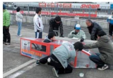
「e-kiden 60分ロングディスタンス」のピットインや選手交代は任意ですが、中には予期せぬトラブルに悪戦苦闘するチームも。