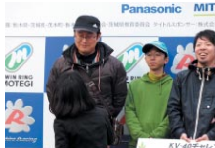
KV-1クラス総合優勝のTeam BIZON。「勝利は予定通りです。でも、勝ててよかった」と自信と余裕、そして安堵のコメント。