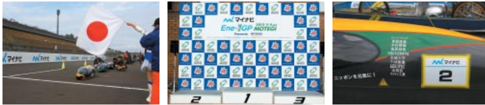
株式会社マイナビ