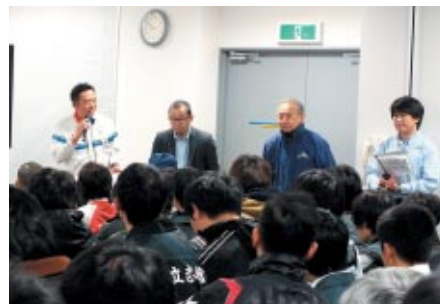
開会式に続いて行われたとフリーフィングでは、競技役員（オフィシャル）各セクションの責任者が競技にあたっての注意事項を説明しました。