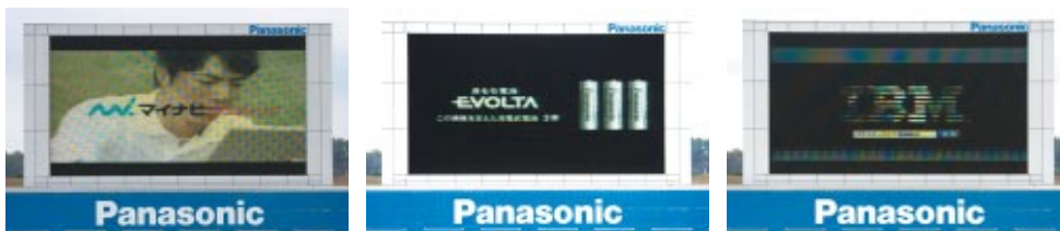
株式会社マイナビ