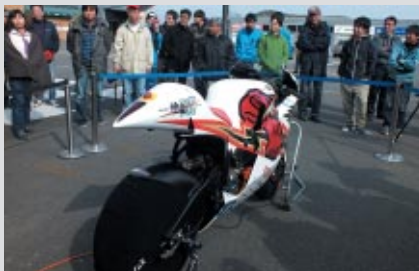
パドックでの展示は、多くの参加者の注目を集めていました。

イギリス・マン島で行われる伝統の2輪レース「マン島TT」に参戦、電動バイククラスで2位に入賞したTEAM無限「神電 貳」の展示やデモランなどのイベントが行われました。