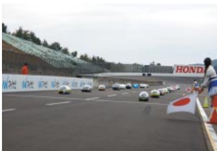
午後の競技はレース形式で争われる「e-kiden 60分ロングディスタンス」。全車がいっせいにスタートして競いました。