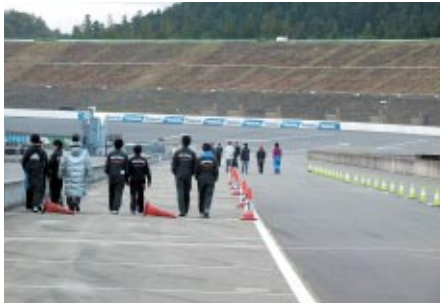
大会当日の朝、走行前にコースを徒歩で下見していただき、路面のチェックなどにお役立ていただきました。