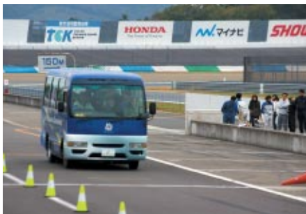
競技開始直前には、バスでもコースの下見を行っていただきました。