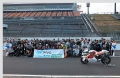
走行後には全員で記念撮影。