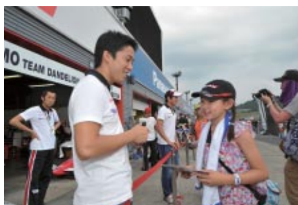
中学生以下のお子さまとそのご同伴者を対象に実施された「キッズピットウォーク」(3日)。