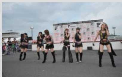
仮面ライダーシリーズ40周年を記念して結成された公式ガールズユニット「KAMEN RIDER GIRLS」スペシャルライブステージ。