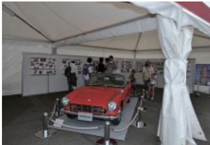
Honda四輪販売50周年を記念して懐かしの名車展示やパネルで紹介した「Honda四輪販売50周年記念ブース」。

「元気と笑顔が大集合!」をテーマに大会期間の二日間にわたって開催された「Enjoy Honda もてぎ2013」。ツインリンクもてぎ場内を舞台に多彩なプログラムを展開。多くのお客さまにHondaの魅力マルチに体験・体感いただきました。