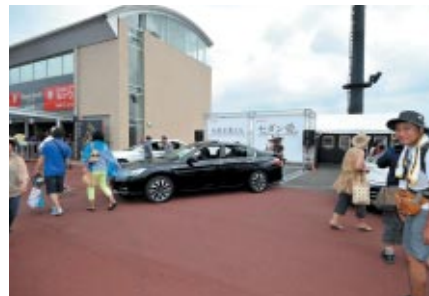
グランドスタンドプラザに展示された新型アコードハイブリッド。