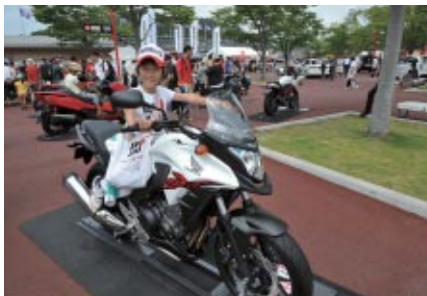
グランドスタンドプラザには、2輪・4輪・汎用のHondaニューモデルが展示されました。