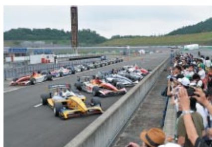
決勝レースを終えたスーパーフォーミュラマシンを身近にご覧いただいた「パークフェルメウオーク」。