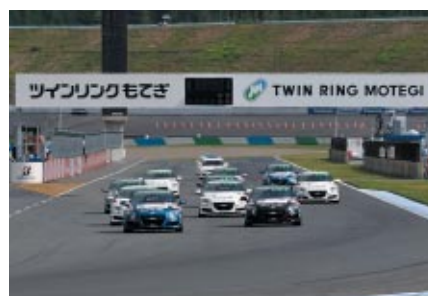
速さと燃費の両立が求められる競技「Honda Sports & Eco Program CR-Z 10リッターチャレンジ」(3日)。