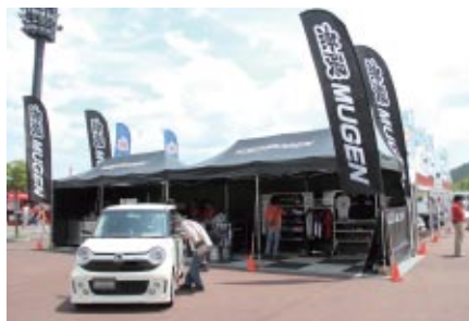
無限オリジナルスペシャルパーツが装着されたHonda N-ONEが展示されたM-TECブース。