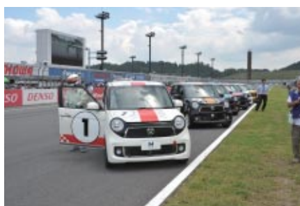
Honda N-ONEレーススタディモデルによるエキシビジョンレース(3日)。