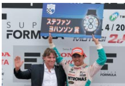
元F1ドライバーのステファン・ヨハンソンさんが来場、エンジンスタートコールや自らの名前を冠した賞のプレゼンターなどをつとめていただきました。