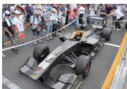
2014年シーズンから投入されるスーパーフォーミュラの新型マシン「SF14」がピットウォーク中に展示され、大きな注目を集めていました。