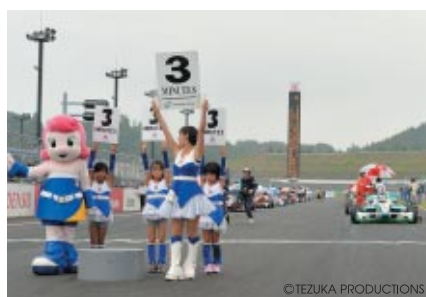
スーパーフォーミュラとF3のカウントダウンボードを掲げていただいたかわいい「なりきりエンジェル」たち。