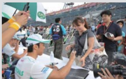
スーパーフォーミュラドライバー、全日本ロードレース選手権のライダーが集結しての豪華サイン会。

翌日の決勝への期待感が高まる中、グランドスタンド特設会場で「前夜祭」が3日(土)夕刻に開催されました。