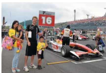
スーパーフォーミュラとF3レース前のグリッドに並んでいただいた「グリッドキッズ」。