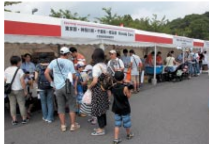
中央エントランスに設置されたHonda Cars ウェルカムブース