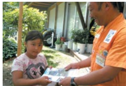
株式会社ホンダモーターサイクルジャパン様にご協賛いただき「つばさ」を体験の皆さまにHonda特製キーホルダーをプレゼントしました。