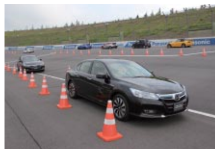
Honda 4輪ニューモデルをレーシングコースで体感いただいた「クルマ試乗会」。