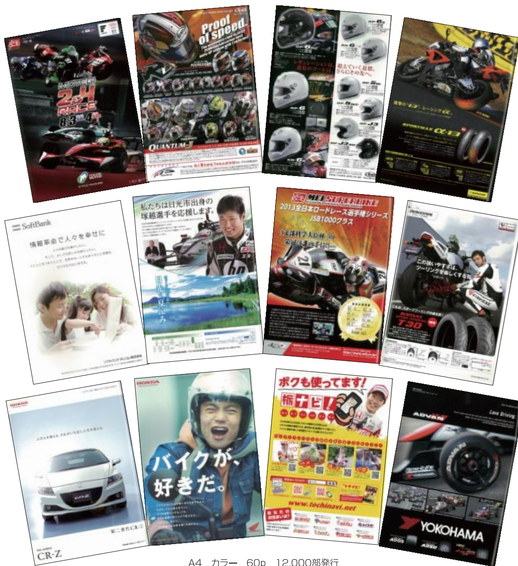
A4 カラー 60p 12,000部発行

株式会社アライヘルメット 株式会社三栄書房 住友ゴム工業株式会社 ソフトバンクテレコム株式会社