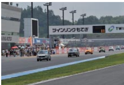
Honda四輪販売50周年を記念し、歴代のHonda車がオーナーの手によってパレード走行しました(4日)。