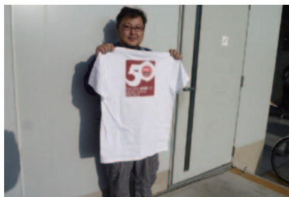
ブリーフィング時に参加者全員に配布されたNGKロゴ入りTシャツ。今回は50周年ロゴがバックにあしらわれています。

実に半世紀もの長きにわたって冠スポンサーとして大会を支えていただいている日本特殊陶業株式会社様。今年も鮮やかな赤色のNGKロゴが晩秋の鈴鹿サーキットを彩りました。