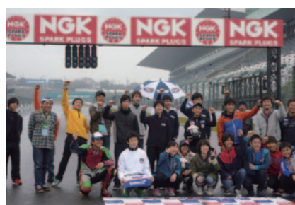
「CBR250R Dream Cup DUNLOP杯グランドチャンピオンシップ」参加者の皆さんによる集合写真。