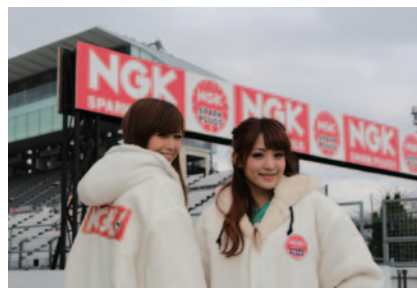
鈴鹿サーキットクイーンもNGKロゴ入りコスチュームを着用し、進行や表彰式のお手伝いなど大会に華を添えました。