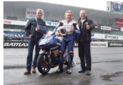
モリワキにゆかりの深いレジェンドライダー、(右から) グレーム・クロスビー氏、ワイン・ガードナー氏がモリワキマシンでのデモランを実施しました。 ※ケビン・シュワツ氏(左)はケガのため走行は中止