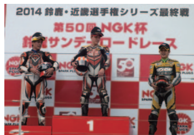
鈴鹿サンデーロードレース各クラス上位3選手にはNGKキャップが贈呈されました。

PICK UP 1 50回目のNGK杯を記念して、Honda CBR150Rデモランが行われ、レジェンドライダーたちが一堂に会し、元気な走りを披露しました。