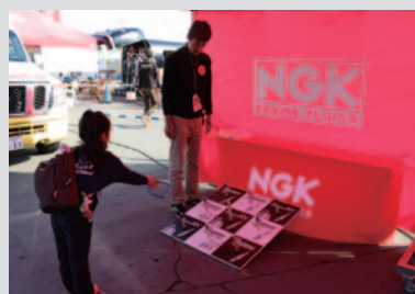
PRブースではお子さまにチェッカー柄をあしらった輪投げをお楽しみいただきました。