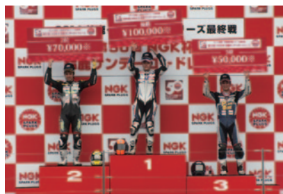
今回は50回記念として鈴鹿サンデーロードレース各クラスの上位の選手とポールシッターには日本特殊陶業様より賞金が贈呈されました。