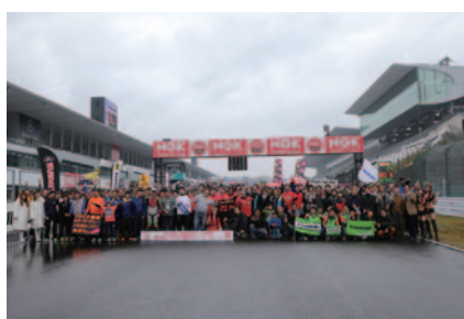
恒例の参加者・関係者による集合写真。こちらは地上からのカットです。