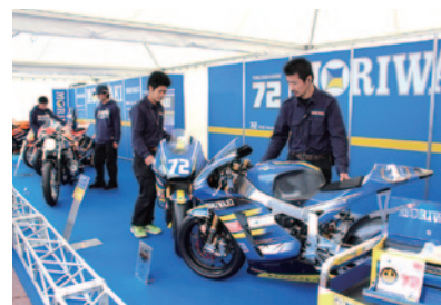
「MD600」(手前)などモリワキマシンのエンジンサウンドをお楽しみいただきました。