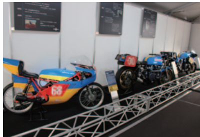
モリワキの礎となったオリジナルマシン一号機「ME125W」(手前)から2014年全日本ロードレース選手権チャンピオンマシン「MD600」まで歴代のマシンが展示されました。