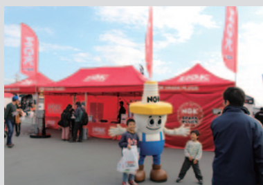
真っ赤なカラーリングが鮮烈な印象のPRブース。

PICK UP 2 「モリワキ祭 一温故知真」のメイン会場となったGPスクエアでも数々のプロモーションを行っていただきました。