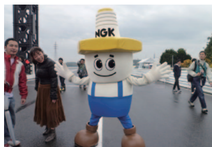
NGKのマスコットキャラクター「スパークー」。GPスクエアでのプロモーションや参加者・関係者集合写真撮影などで大活躍しました。