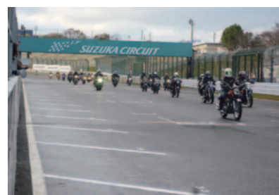
バイクパレードでは、国際レーシングコース、フルコースをレジェンドライダー先導のもと、ご自分のバイクで体験走行いただきました。