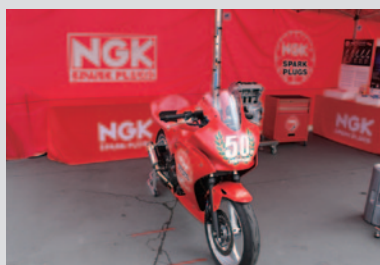
TSRによって制作され、PRブースに展示されたNGK杯50回記念スペシャルカラーのHonda CBR250R。