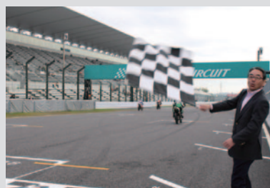
デモランのチェッカーフラッグは尾堂社長に振っていただきました。

PICK UP 2 「モリワキ祭 一温故知真」のメイン会場となったGPスクエアでも数々のプロモーションを行っていただきました。