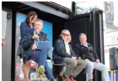
レジェンドライダーたちによる豪華なトークショーが行われ、多くのファンが集まりました。