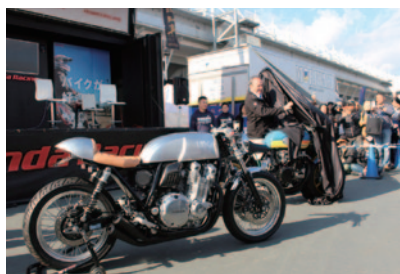
Honda CB1100をベースにしたモリワキコンセプトマシン(手前)とカワサキZ1をベースにしたG.クロスビー氏プロデュースマシンのアンペイルが行われました。