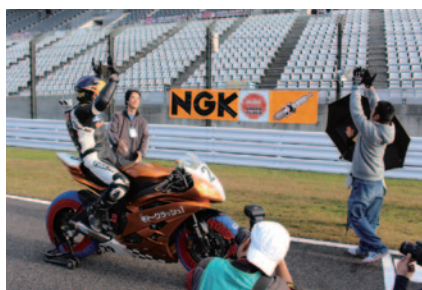
ポールポジションの真横に掲出されたNGK幕。ホームストレートのフェンスには他にも2か所に幕が掲出されました。