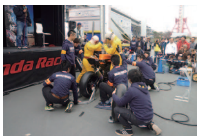
モリワキとパートナーであるTOHO Racingのマシンをもちいて、8耐のピットワークを再現しました。