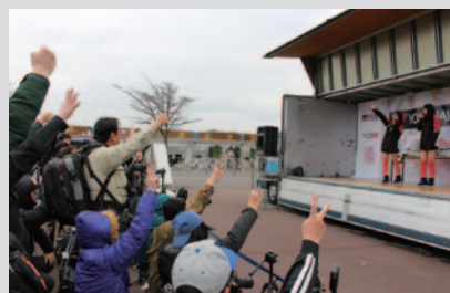
NAPAC & TOYOTA GAZOO Racingの豪華賞品がプレゼントされたじゃんけん大会。