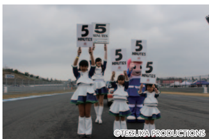
ツインリンクもてぎエンジェルと一緒にスーパー耐久スタート進行のカウントダウンボードを掲出いただいた「ドリーム☆変身Pitエンジェルズスペシャル! ~スタート直前! ドキドキのカウントダウンボードアップ! ~」(3日)。