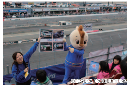
コチラファミリーがやってきて、子どもたちに分かりやすくレースを解説した「コチラファンクラブ限定! スペシャル観戦シート」(2日)。