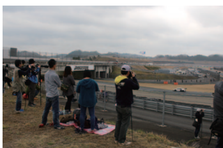
1コーナーイン側、5コーナーイン側、5コーナーアウト側(写真)に設けられた「激感エリア」。パドックパスをお持ちのお客様に迫力の観戦をお楽しみいただきました。