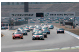
プロフェッショナルシリーズ