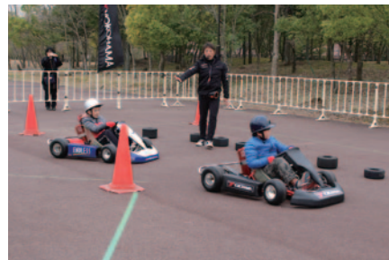
子どもたちにエンジン付き乗り物の楽しさを味わっていただいた「スーパー耐久キッズカート体験会」。