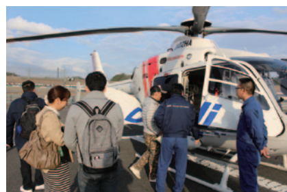
普段入れないコントロールタワー内運営施設や救急ヘリを間近にご覧いただいた「サーキット・ツアーズ&ドクターヘリ見学」を実施しました(3日)。