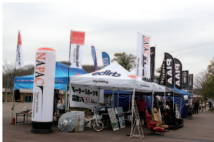
自動車用品、アフターマーケットの振興を図るNAPAC(日本自動車用品・部品アフターマーケット振興会)加盟各社様のブースがグラนด์スタンドプラザで華やかに展開されました。