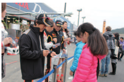
中学生以下のお子さまとご同伴者に無料でお楽しみいただいた「コチラレーシングのキッズピットウォーク」(2日)。