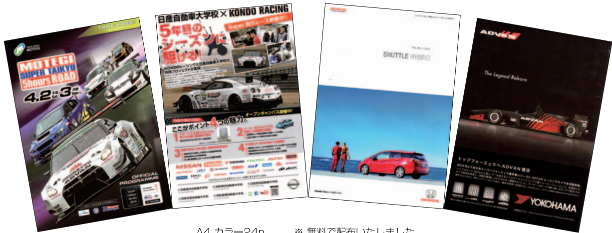
A4 カラー24p ※ 無料で配布いたしました。