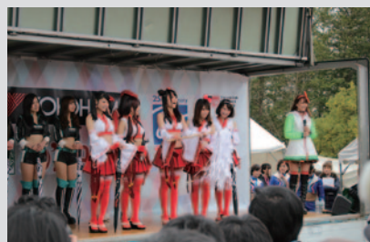
各チームのレースクイーンが一堂に会した「レースクイーンオンステージ」。