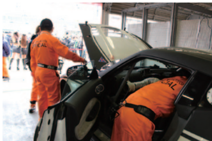
ピットウォーク時に行われた車両や燃料補給装置のチェック「公開車検」(2日)。

大会期間は春休みの真っ只中。ファミリー向けのイベントを中心に、4月最初の週末をレースのみならず多彩なコンテンツでお楽しみいただきました。