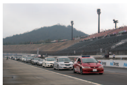
決勝レース前のロードコースをご自分の愛車で体験走行いただいた「みんなでスーパー耐久ファミリーパレード」(3日)。