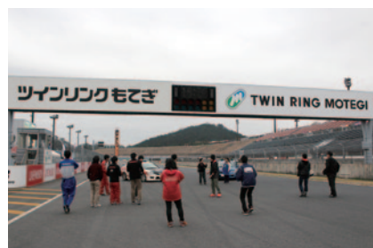
公式予選日の全セッション終了後にロードコースを開放、熱い走りの余韻が残るサーキットをご体験いただいた「家族みんなでコースウォーク」(2日)。