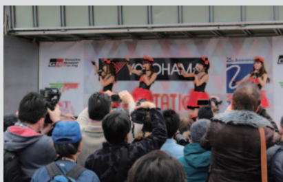
スーパー耐久2016イメージガール「FRESH ANGELS」のライブステージ。