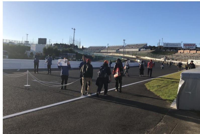
【JAF会員限定】パークフェルメウォーク最終コーナーエリア限定入場