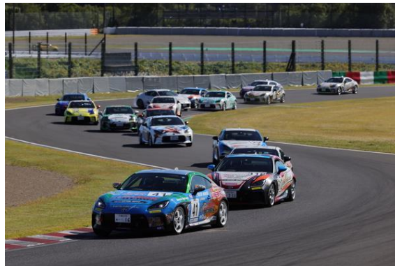
GR66/BRZ Cup 2023 クラブマンシリーズ