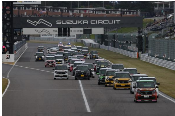
N-ONE OWNER'S CUP