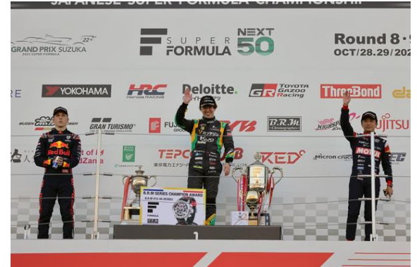
SUPER FORMULA シリーズ表彰