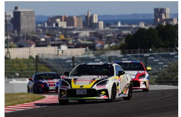
GR66/BRZ Cup 2023 プロフェッショナルシリーズ